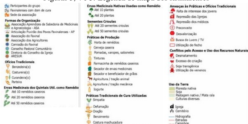
Figuras 3, 4 e 5. Legenda de mapa dos faxinalenses