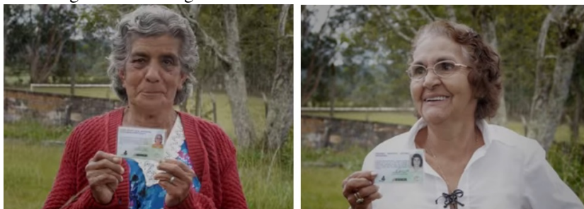
Figura 7 e 8. Imagens das benzedadeiras exibindo suas carteirinhas