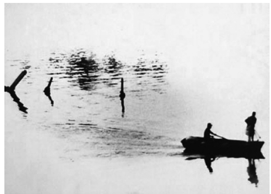
Fotografía de la colección Entre palos y botes , donde el autor utiliza el alto contraste para mostrar los detalles más significativos de cada toma. Autor: Fabrizio Vignali.

Desde el primer día de octubre y hasta el 22 de diciembre, tuvo lugar en nuestro país la segunda edición de Fotograma, el Encuentro Internacional de Fotografía que organiza cada dos años el Centro Municipal de Fotografía (CMDF) de la Intendencia Municipal de Montevideo (IMM).