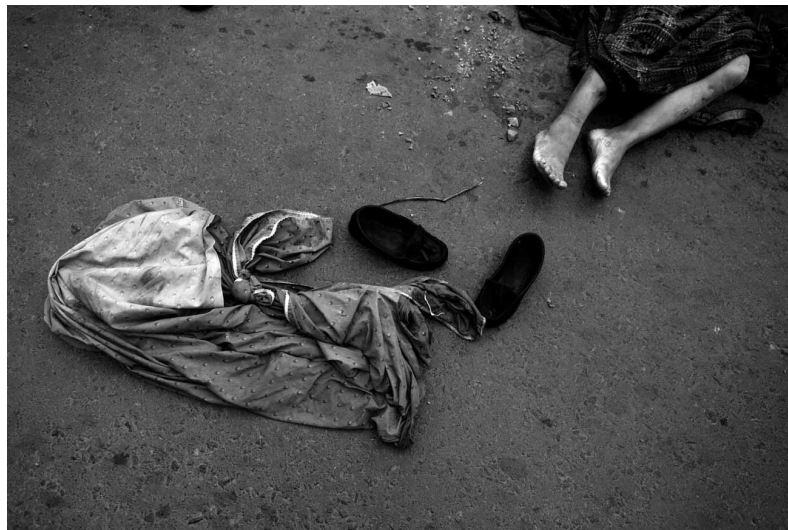
Guatemala, 2007. Una mujer no identificada, encontrada muerta junto a Rosa Vázquez Marroquín, en Nueva Chinautla. Autor: Walter Astrada.