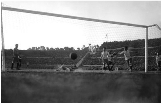
Estadio Centenario. Final del Campeonato Mundial de Fútbol (1930).