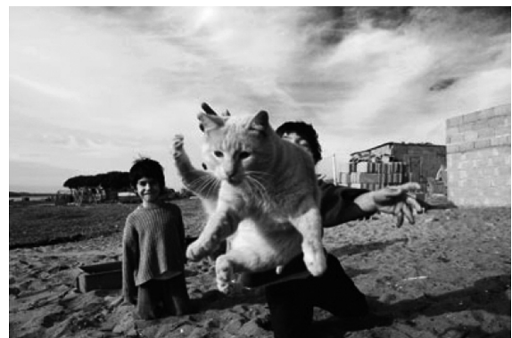
Fotografía de la colección Igual a la par - Comunidad de niños de la Laguna de Rocha . Esta colección cuenta las condiciones extremas en que vive una comunidad de pescadores, a orillas de la desembocadura de la Laguna de Rocha.