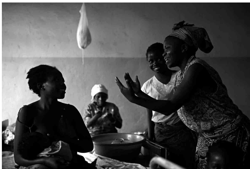
Congo, 2008. Una mujer cantando a otra, quien dio a luz a un bebé resultado de una violación.