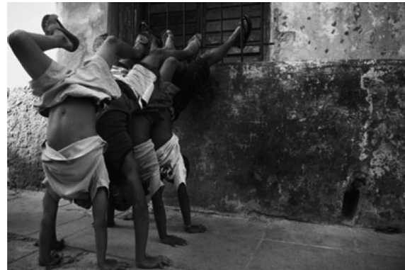
Fotografía de la colección Desde Cuba: imágenes que el tiempo no quiere borrar , que presenta un subjetivo vuelo por Cuba y constituye una importante documentación antropológica.