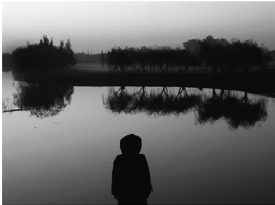
Fotografía de la colección Aguas turbulentas , donde se entremezclan el poder de la naturaleza y la fuerza del hombre.