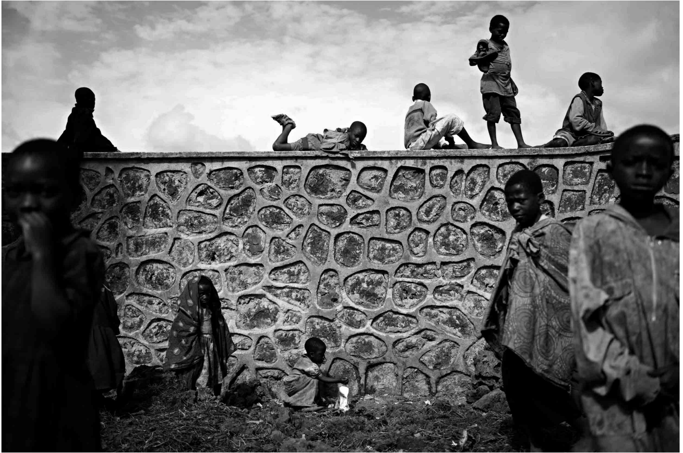
Congo, 2008. Un grupo de niños espera en el patio de la clínica de Mercy Corps por una distribución de galletas energéticas en el campo de desplazados de Kibati.