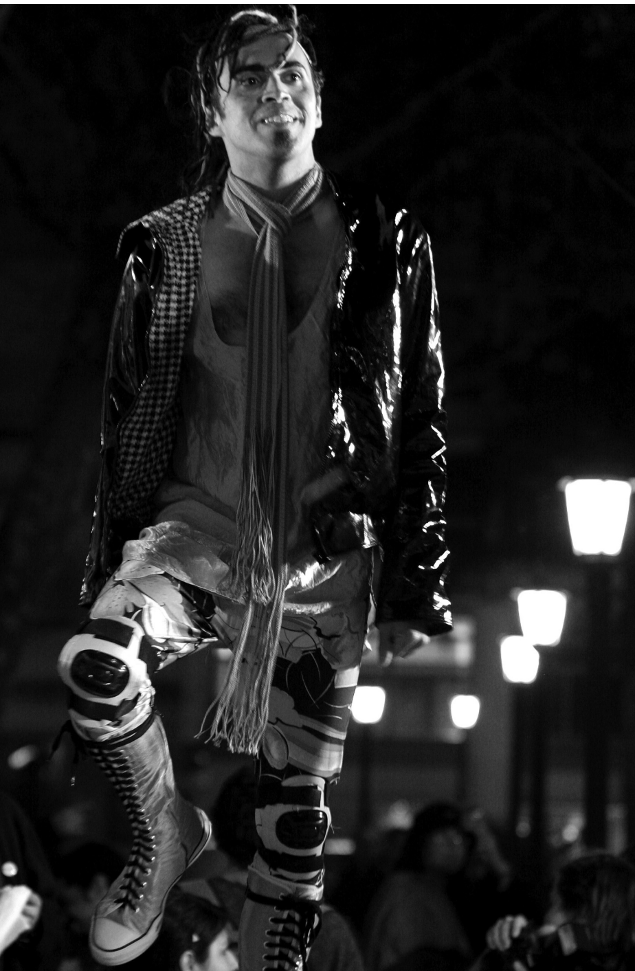
Por P. P.