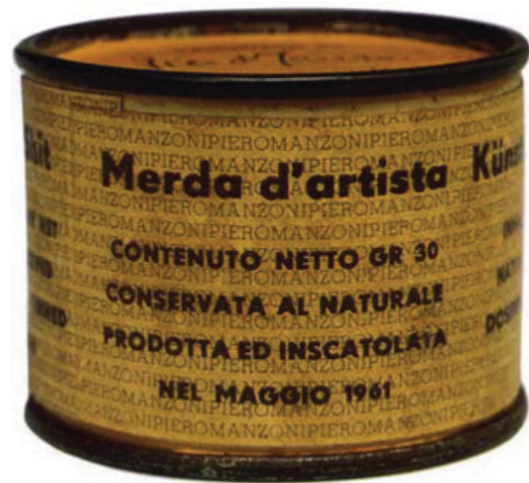
01 Enemigo mío (Wolfgang Petersen 1.985). Cartel original de la película