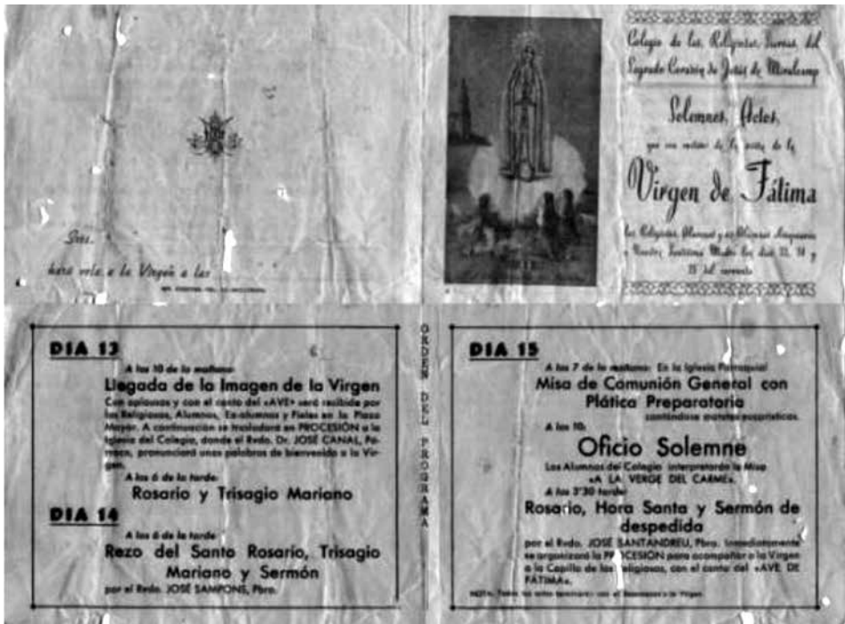
Programa d'actes del Col·legi del monges. Miralcamp

Als nostres pobles, després de la guerra civil, l'Acció Catòlica prengué una dimensió de gran importància social. Fou una eina clau al servei de la parròquia per sensibilitzar i formar els joves en la fe catòlica. Estava estructurada en quatre branques: homes, dones, nois i noies, i les seves actuacions s'articulaven a través del trinomi Pietat, Estudi i Acció. I una de les eines metodològiques potents de formació era el "Círculo de Estudios" 8 .