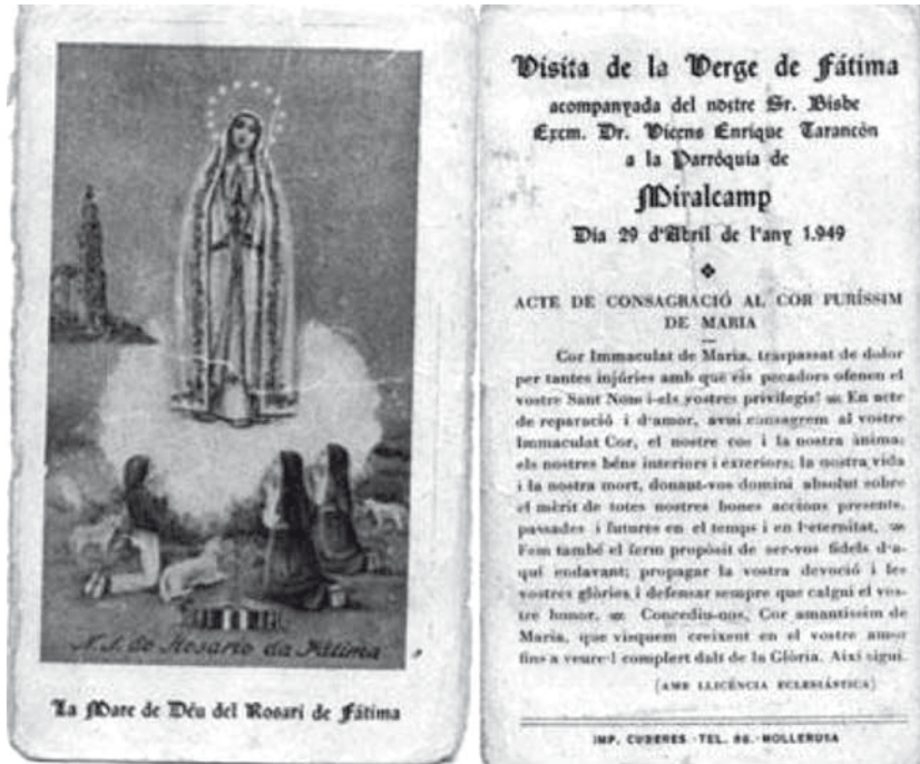
Recordatori de la visita de la Verge de Fátima. Miralcamp