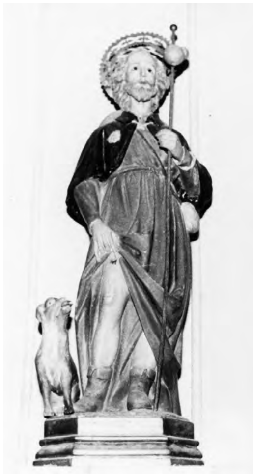
Església de Sant Nicolau, de Bellpuig. Imatge de sant Roc a la Capella de Sant Isidre.