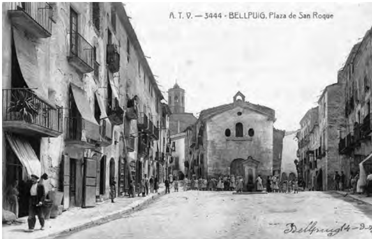
Primera tarja postal coneguda de la plaça Sant Roc (a inicis del segle XX).