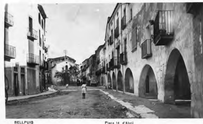
Tarja postal d'una col·lecció una mica posterior (editada a l'inici de la guerra).