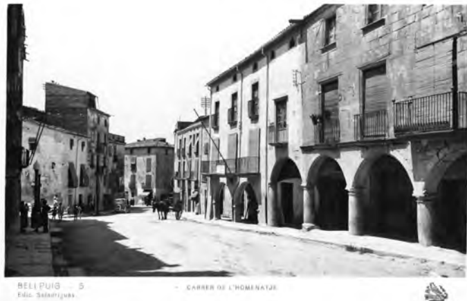
Tarja postal de la col·lecció Oriol. Bellpuig (edició Bellpuig - Barcelona al temps de la República). Vista de la part posterior de l'illa de cases que serà enderrocada.