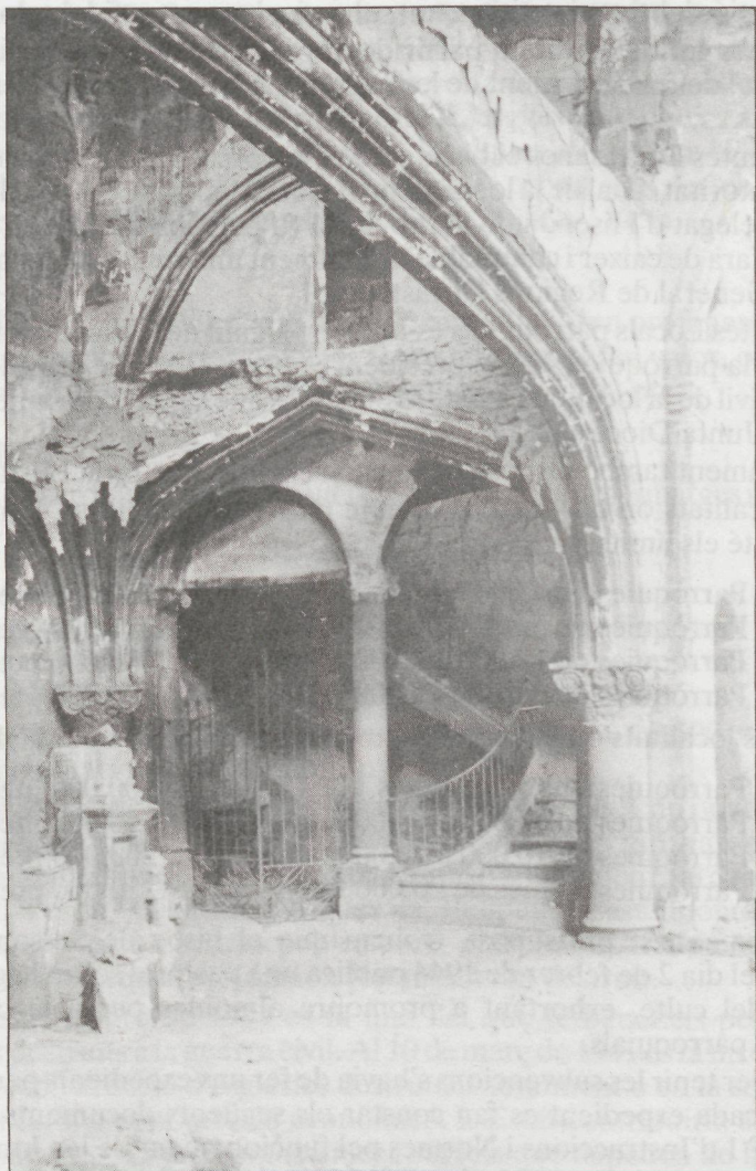
Escala cap al cor després de l'incendi, a l'església parroquial de Bellpuig.