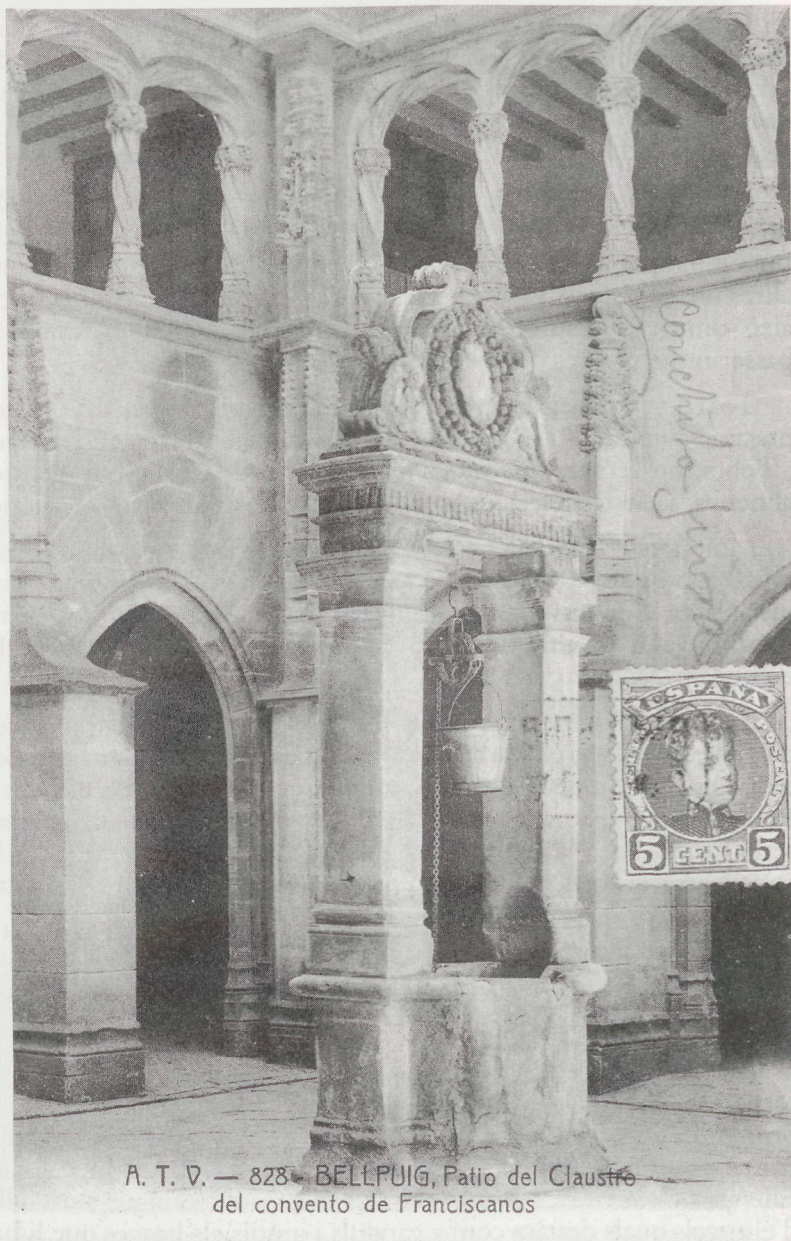
Vista parcial d'un dels patis del convent, amb el pou de la cisterna. Targeta postal editada per Angel Toldrà Viazo. Barcelona

els dos poders fàctics -en podríem dir- de la població, el cap dels carlins i el rector. Se n'alliberà tan aviat com va poder, i aquest fet li congruà les ires del rector, que l'acusà públicament de liberalot perquè havia conservat com a operaris tan sols una colla de perdularis que no anaven a missa.