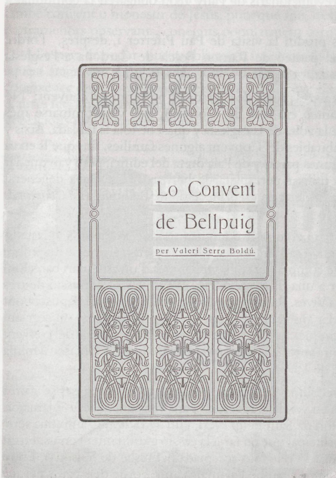
Edició del treball Lo Convent de Bellpuig , de Valeri Serra, premiat als Jocs Florals de Lleida de 1907 (Sol & Benet, Lleida, 1908)

I afegeix: “Tres anys justos s’han estat pera refer la església y poders’hi celebrar missa. La nova església ocupa com queda dit lo mateix lloch de la vella, ab la diferencia de que les capelles de totes dugues bandes, son practicades en la paret, y p’el darrera de les del cantó del Evangeli, hi passa un espayós corredor. Lo cor, pessa del tot esgambiosa, se comunica ab la Galeria del Duch per medi de un corredor que ofereix quatre amples tribunes engrandint mes la església. No está del tot acabada, per mes que puguin celebrarshi’ls divins oficis, solzament hi ha