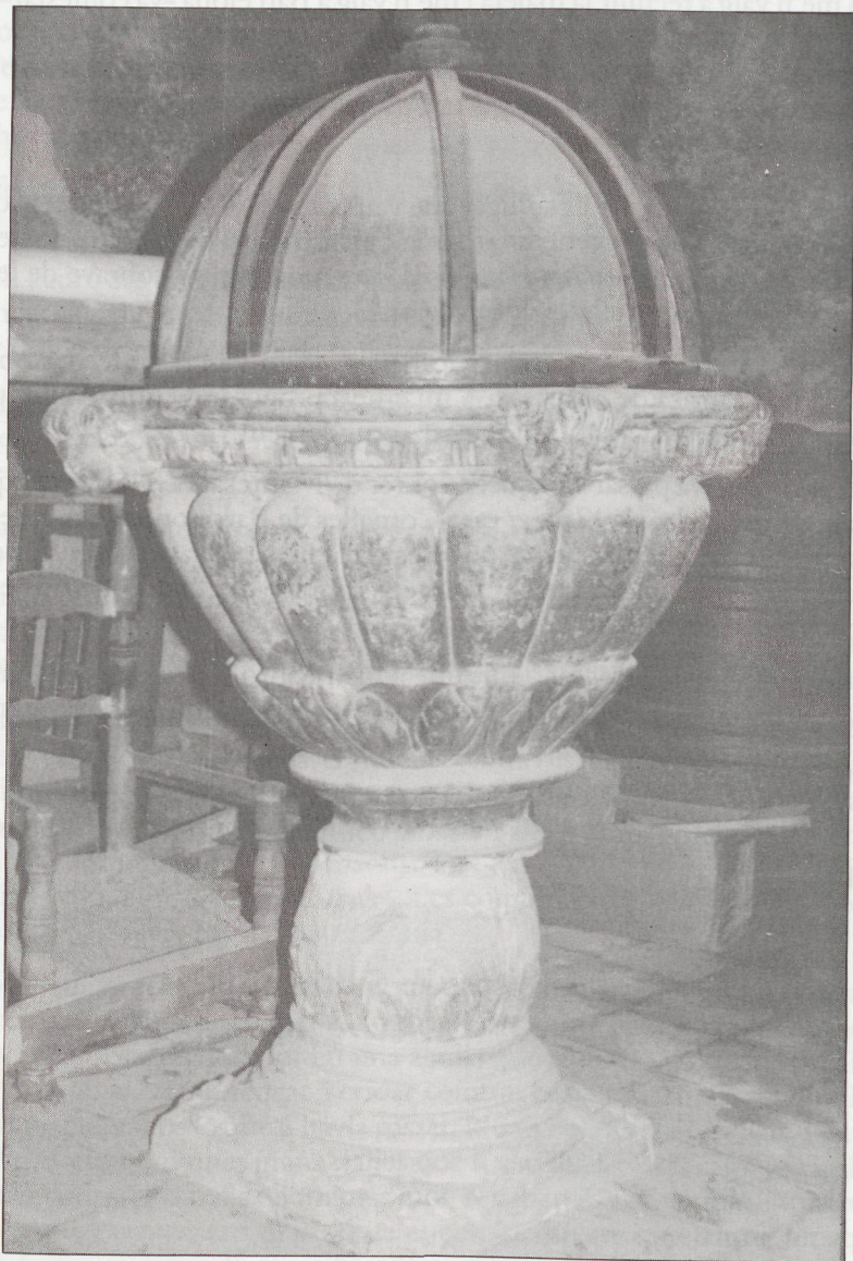
Antiga pica baptismal de l'església de Sant Nicolau, de Bellpuig