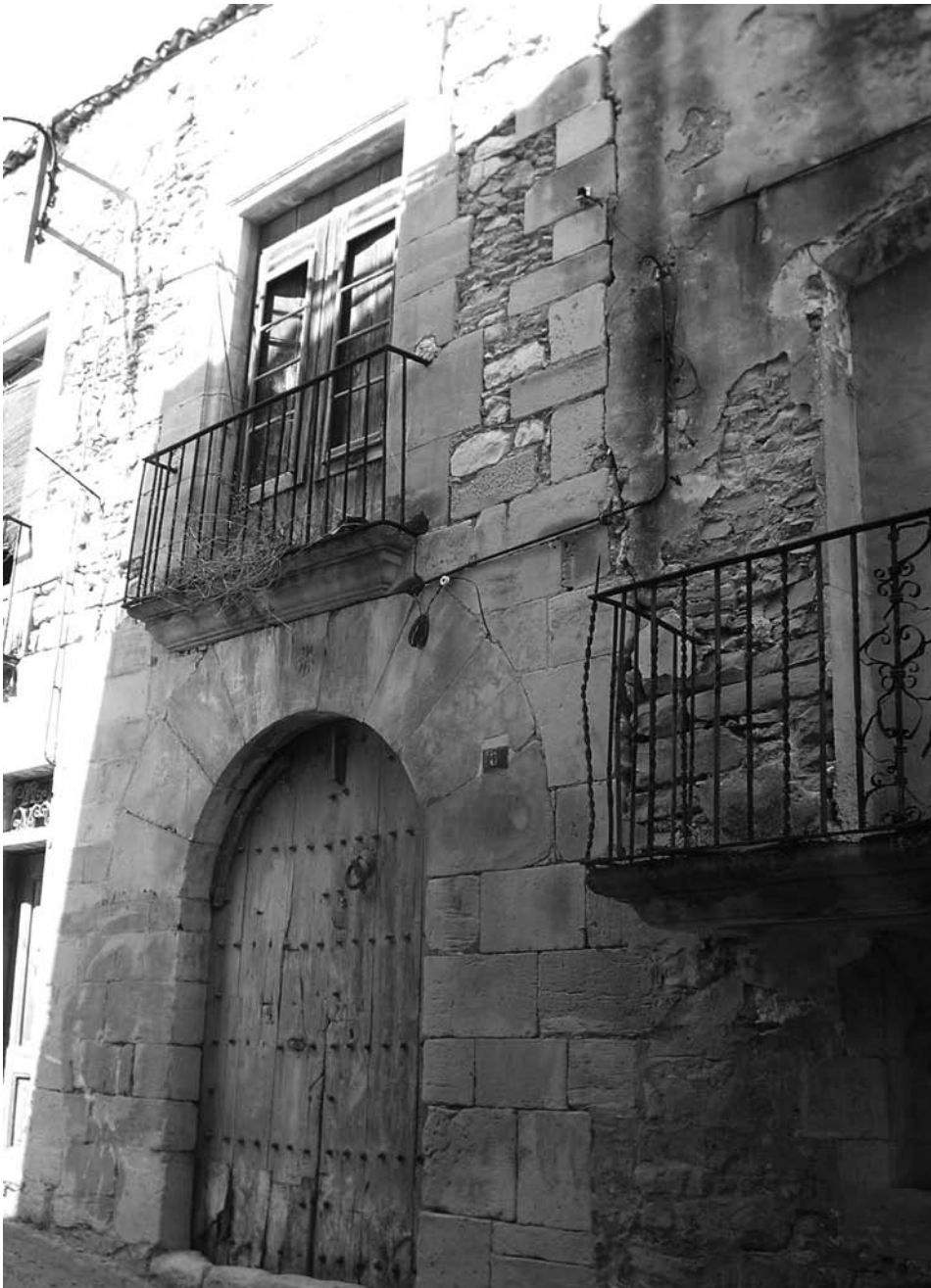
Portada de la façana de la casa dels protocols notariais de la baronia, de 1676, i antiga botiga del senyor al carrer Castell.