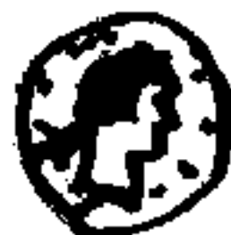
Moneda de coure.