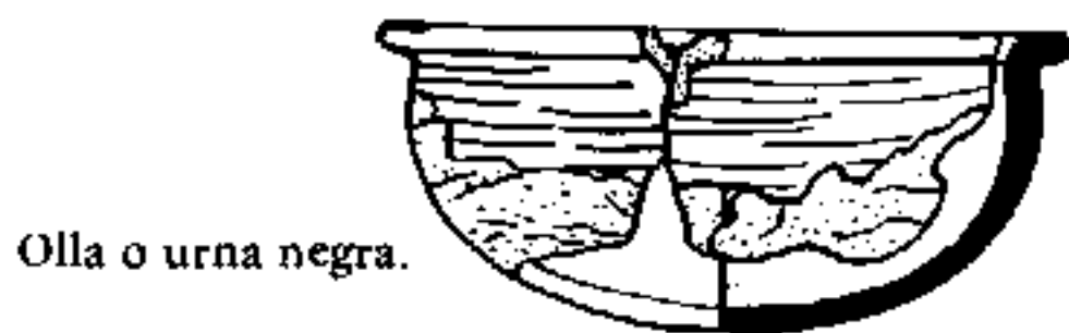
Olla o urna negra.