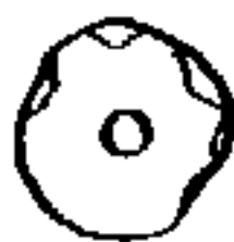
Peça de collaret discoïdal.