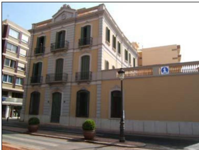
Museo del Mar

A mediados del siglo XVIII eran muchos los navegantes lloretenses que iban a América de una forma más o menos declarada. Pero en el año 1778, el rey Carlos III promulgó el Decreto de Libre Comercio con las colonias americanas. Este hecho, no sólo supuso un gran impulso para la actividad naviera del pueblo (entre 1812 y 1869 se