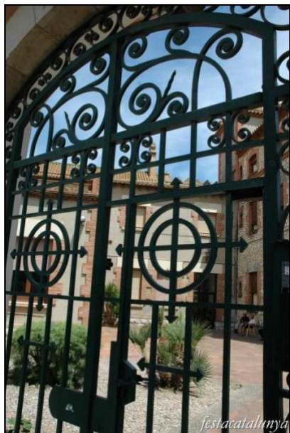
El Redós de Sant Josep y Sant Pere

San Pedro de Ribas, municipio de interior fiel a la tradición y a la historia, da la oportunidad de descubrir el legado indiano del siglo XIX, patrimonio que te abrirá las puertas a una época marcada por aventuras e importantes cambios sociales.