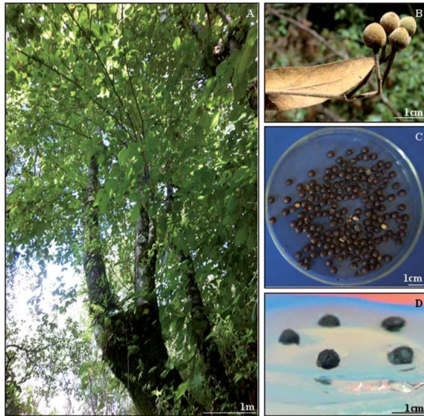
Fig. 1. A. Árbol de Tilia mexicana , B. Semillas de colecta reciente, C. Semillas sin pericarpio y D. Semillas cultivadas in vitro en medio MS con 0.05 mg/L de BA.