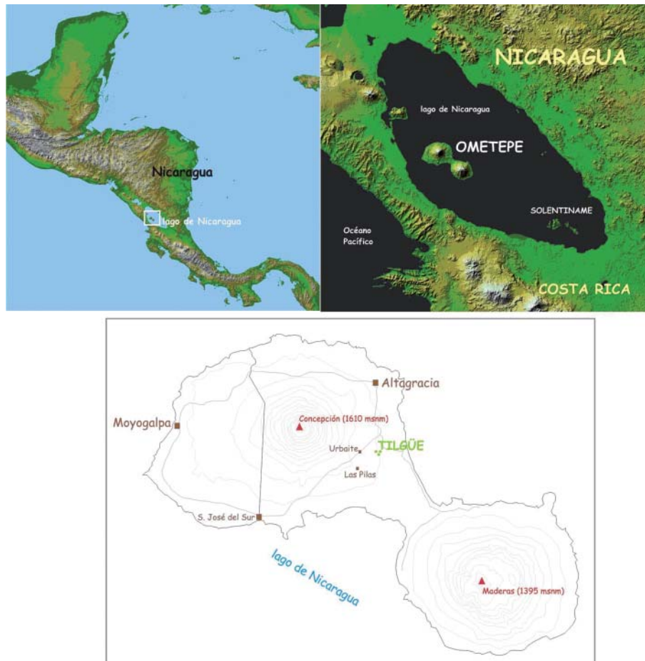
Fig. 1. Localización de la comunidad de Tilgüe, en la Isla de Ometepe (Departamento de Rivas, Nicaragua).