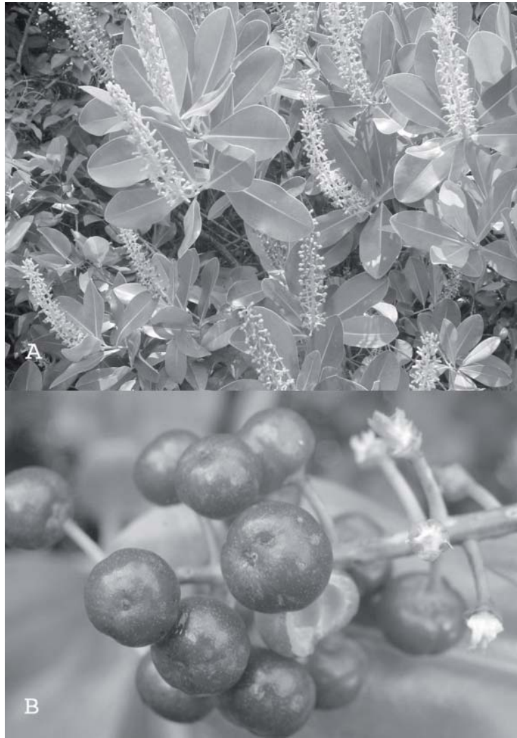
Fig. 1. Souroubea loczyi (V.A. Richt.) De Roon ssp. loczyi de Roon. A) ramas floríferas general e inflorescencias ( E. Endañú Huerta 997, CICY, MEXU); B) frutos ( E. Endañú Huerta 1216, CICY, MEXU).