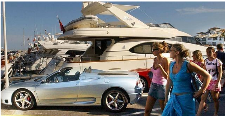
"Marbella resurge como destino de lujo tras sacudirse el estigma de Malaya" ( Diario Sur , 20 de abril de 2013)

El modo en que los estudios se centran exclusivamente en los impactos culturales del turismo, sin mirar a las causas político-económicas que están en la base de los procesos, reconoce implícitamente y sin discusión los desequilibrios en las relaciones de poder (Salazar, 2006). Como avanzábamos en el apartado anterior, la pesada descripción de una sociedad sometida por el fenómeno turístico y colonizada por el visitante termina por asfixiar y negar del todo cualquier posibilidad de resistencia. El análisis crítico y el discurso del poder se convierten en caras de una misma moneda 13 .