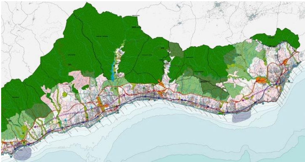
Plano de ordenación del Plan de Ordenación Territorial de la Costa del Sol Occidental, 2006

La industria turística también se ha presentado a los ojos de los ciudadanos cuyos recursos explota como un elemento inamovible y deseable del desarrollo. A continuación veremos cómo discursos unívocos procedentes de diferentes ámbitos —el de los medios de comunicación, dirigido al público masivo, y el de cierta inclinación de la investigación social, como representante del conocimiento experto— atenazan esa percepción de forzada sumisión y falta de arreglo.