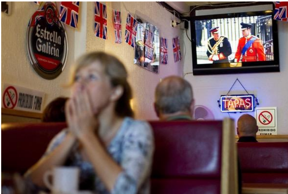
“British Royal Wedding Celebration in Costa del Sol” ( Zimbio , 28 de abril de 2011)

Según la misma O'Reilly, su trabajo no aspira tanto a extraer conclusiones cerradas como a aportar matices que desmontan ciertas ideas asumidas y añaden complejidad a otras. Su investigación se mueve reconocidamente en la tensión de las dicotomías observación-participación, objetividad-subjetividad, pero, gracias a eso, descubre desde dentro partes del cuadro que hasta entonces permanecían veladas. Esta misma actitud sirve de guía al trabajo descrito en el siguiente apartado, punto de partida y a la vez final de la línea de reflexión propuesta a lo largo de este texto.