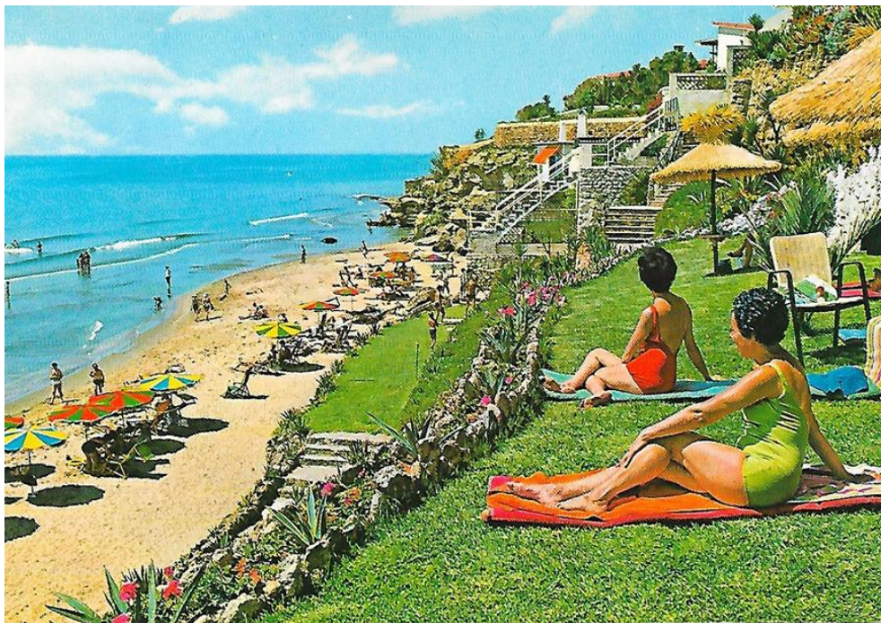
Postal, 1968. Torremolinos (Málaga). Playa del Hotel Riviera