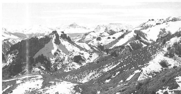
La selva y los Andes, refugio inhóspito de la guerrilla sudamericana y de los nazis huidos.

Y la noticia más sorprendente sería la propiciada durante el verano de 1948 por el Tribunal alemán de desnazificación , al citar en estrados a los desaparecidos Hitler y Eva Braun, declarándolos en rebeldía procesal por no haber comparecido, a fin de disponer de sus bienes patrimoniales 25 . Lo que era consecuencia de una providencia del Registro Civil, emitida previamente a instancia de la familia Braun: