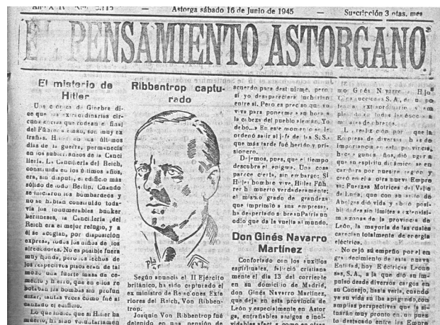
La prensa local y la desaparición misteriosa del Führer.

Con tantos interrogantes, el Gobierno argentino ordenaría en 1997 la confección de un estudio sobre las presuntas actividades del nazismo en la nación 40 . El informe en sí, catalogado por la inteligencia norteamericana como un ensayo general 41 , sostuvo que la Argentina había recibido cerca de doscientos fugitivos relacionados con la Alemania de 1939-1945, portando consigo algún botín bélico de importancia, pero apenas se pronunciaba sobre la hipotética presencia residencial de sus líderes principales.