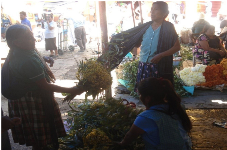
Figura 3a. Feriado de $10 de tlayudas y $10 de limones por dos ramos de flores silvestres.