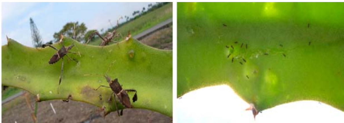
Figura 3. Leptoglossus zonatus (Dallas) sobre penca de pitaya amarilla. Derecha. Clorosis en cladodios de pitaya amarilla causado por L. zonatus . Nótese las hormigas atraídas a los exudados de las heridas.