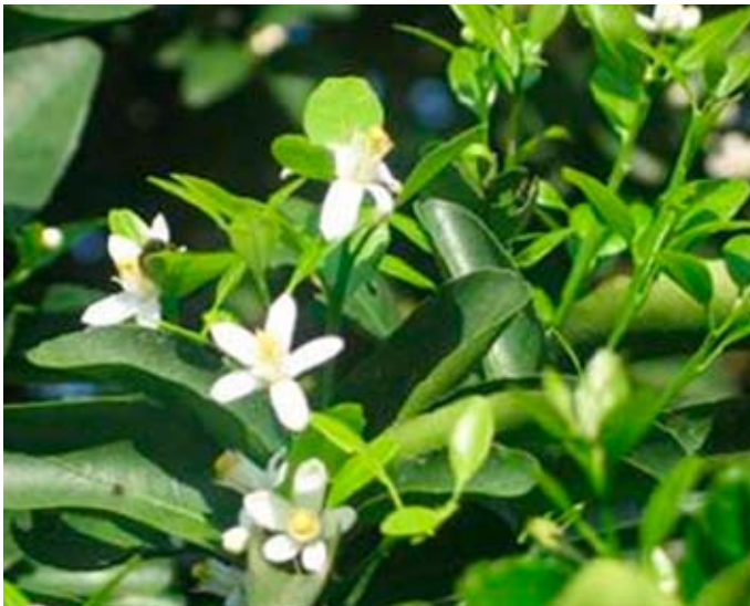
Figura 2. Brotación y floración de la mandarina 'Arrayana' en el inicio de la temporada de lluvias en el C.I. La Libertad, Villavicencio, Meta

Características de las flores: Las flores son solitarias, hermafroditas, pueden ser axilares y/o terminales, se contabilizaron cinco pétalos blancos que midieron 10,43 \pm 2,0 mm de longitud y 3,9 \pm 1,0 mm de anchura, su relación longitud/anchura fue de 2,67. El pedicelo presentó una longitud promedio de 5,87 \pm 2,0 mm, las anteras son amarillas, con dehiscencia longitudinal y son más cortas en relación con el estigma (Figura 2). El estilo es recto, los estambres presentaron una longitud promedio de 1 mm. La floración principal se inició dos semanas después de iniciadas las precipitaciones; aunque pueden presentarse presencia de algunas flores aisladas en especial en el segundo semestre sin que produzcan fruta de valor comercial (Orduz et al. , 2010).