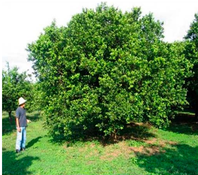
Figura 1. Árbol de mandarina 'Arrayana' sobre mandarina 'Cleopatra', edad 8 años. Terraza alta del piedemonte del Meta, Corpoica C.I. La Libertad

Descripción del tipo de planta: Los árboles de mandarina 'Arrayana' tienen una altura promedio de 4,26 \pm 0,35\text{ m} y un diámetro de copa de 4,5 \pm 0,28\text{ m} (Figura 1), con hábito de crecimiento erecto y de forma esferoide, la ramificación es densa; la inserción de las ramas al tronco principal presenta un ángulo agudo. Los árboles son vigorosos, el volumen de copa fue de 40\text{ m}^3 . En el año de evaluación la producción fue de 128 kg de fruta por planta, mientras que el índice de eficiencia productiva fue de 2,95 kg de fruta por \text{m}^3 de copa. Las plantas iniciaron su producción en el quinto año después del trasplante produciendo 5 kg/planta, 40 kg en el sexto año y 65 kg en el séptimo año.