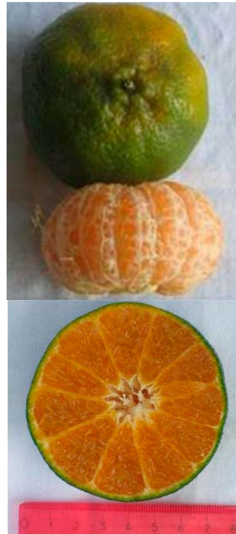
Figura 3. Fruto de la mandarina 'Arrayana' del Piedemonte llanero, Corpoica C.I. La Libertad, Villavicencio, Meta

El peso promedio de la fruta en el momento de la cosecha comercial (8,5 meses después de la caída de pétalos) fue de 180,6 \pm 8,5 g. La fruta presentó un diámetro longitudinal de 56,2 \pm 2,0 mm y transversal de 78,6 \pm 3,0 mm, la relación entre el diámetro y la altura del fruto fue de 1,4 (Figura 3). La corteza posee una estructura papilar en la superficie; en esta se contabilizaron 44 \pm 5 glándulas oleaginosas/ \text{cm}^2 perceptibles al observador, el espesor