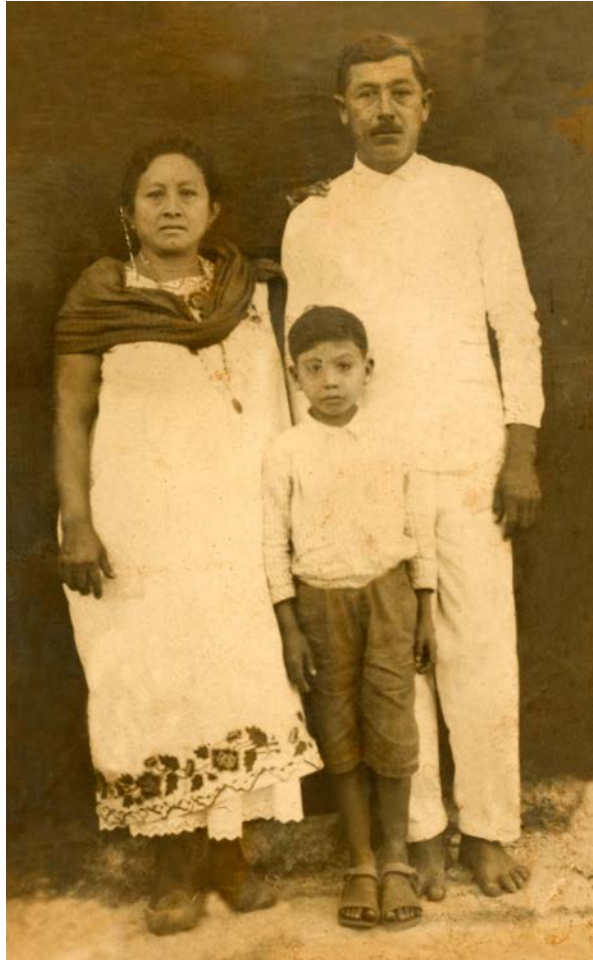
FIGURA 3. Uno de los grupos domésticos mayas originario de Kalkiní, que se establecería en Chicbul desde mediados de la década de 1960 (Archivo fotográfico de la revista Blanco y Negro , del Instituto de Cultura de Campeche).