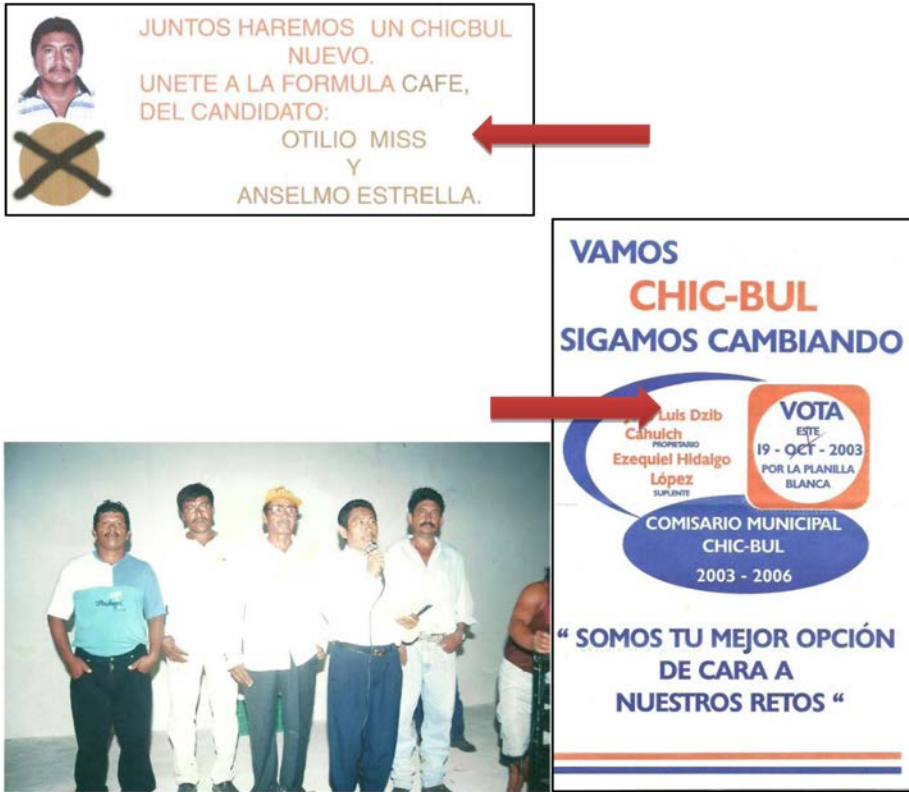
Candidato maya a la comisaría municipal y sus seguidores mestizos, 2003