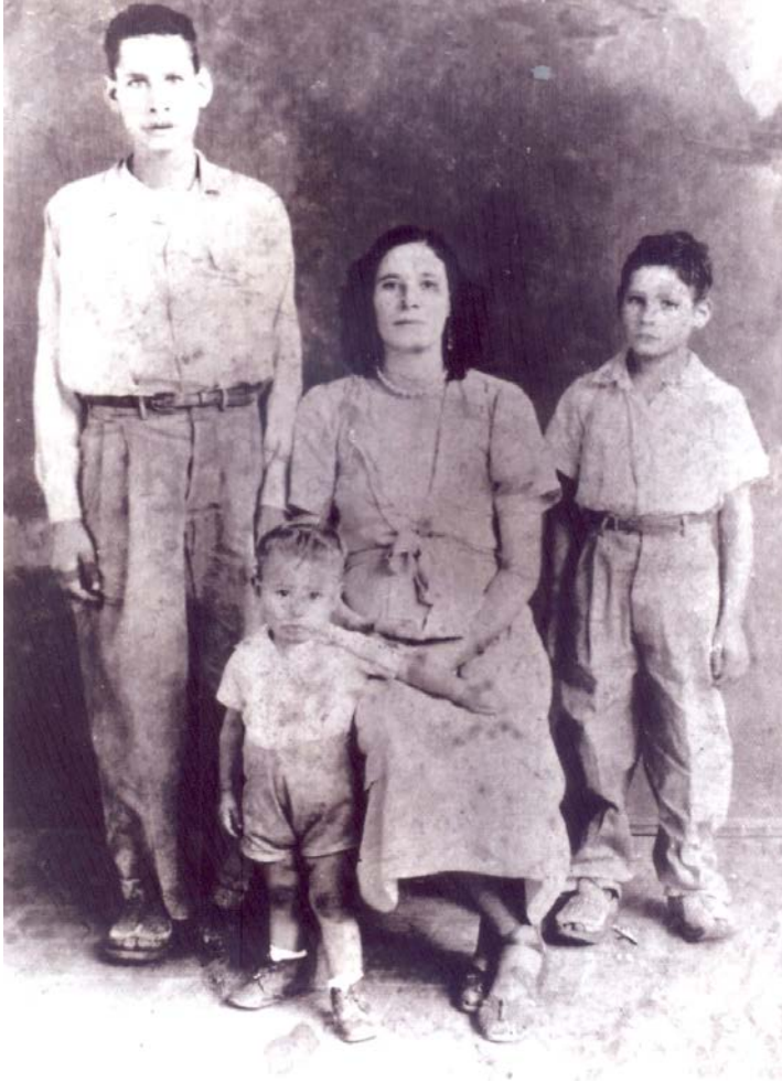
FIGURA 2. Grupo doméstico “colono” originario del norte del país.