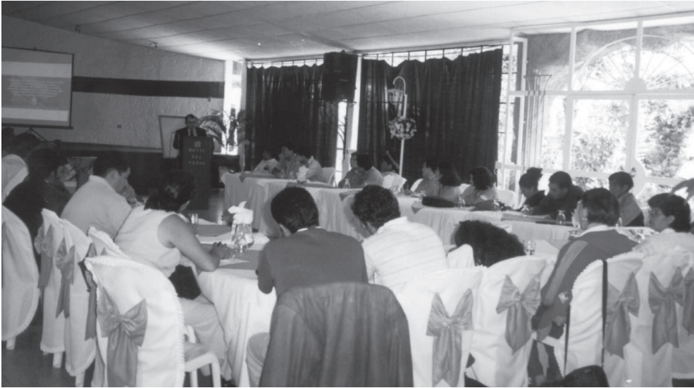
Asamblea de la mesa departamental de concertación de Huehuetenango

Fuente: Asamblea de la mesa departamental de concertación de Huehuetenango con la participación de representantes de la Comisión Presidencial sobre Descentralización y de la Comisión Presidencial sobre Derechos Humanos el 25 de abril de 2002. Foto tomada por la autora.