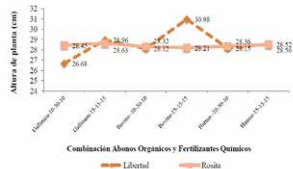
Figura 2. Altura de planta a los 90 días en la interacción variedades por abonos orgánicos por fertilizantes químicos en el cultivo de dos variedades de papa ( Solanum tuberosum var. Libertad y var. Rosita)

Estos resultados guardan estrecha relación a lo planteado por Zamora y Rodríguez (2008) y Buchanan (1993) quienes obtuvieron valores superiores con la aplicación de la fertilización orgánica, el desarrollo vegetativo en la mayoría de los casos, fue muy superior a la fertilización química, lo que evidencia las bondades del uso de este tipo de abono para la fertilización del cultivo de la papa.