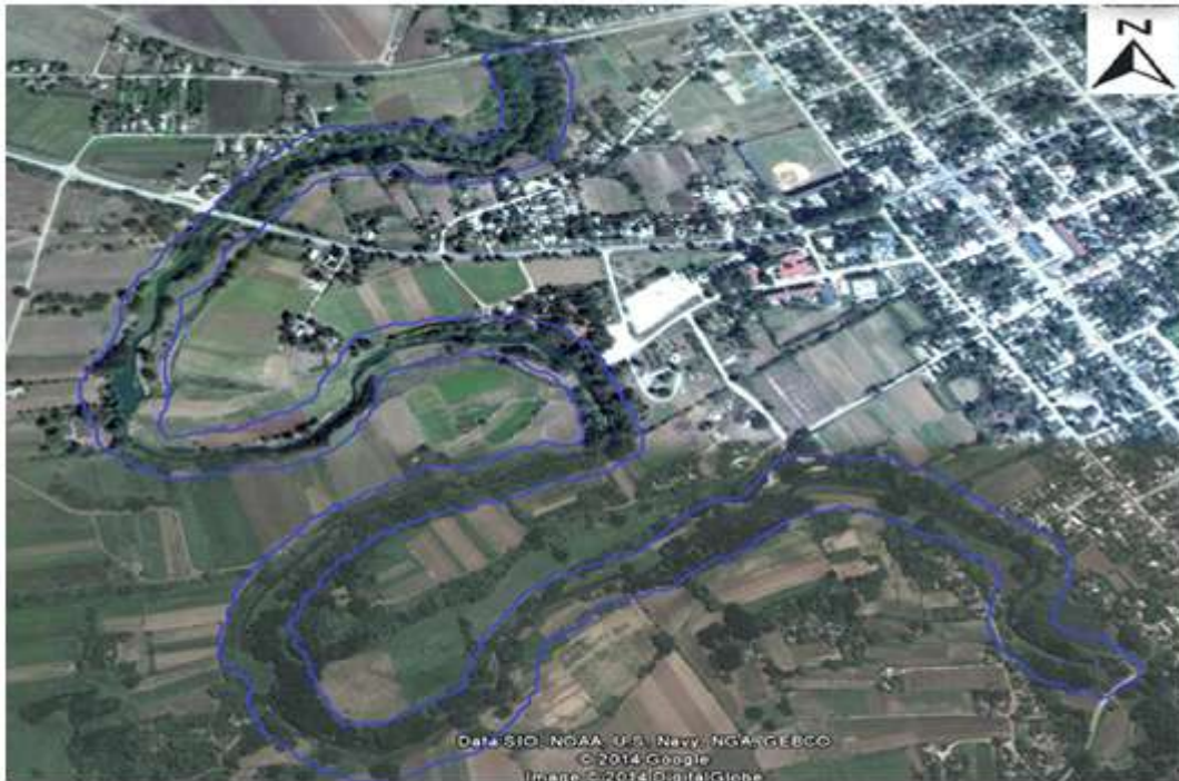
Fig. 1. Ubicación espacial del área de estudio.

ferrocarril (figura 1) con una superficie de 20,45 ha.