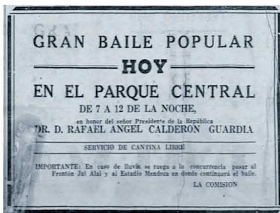
Figura 3. Anuncio del baile popular en celebración de la toma de poder de Rafael A. Calderón. 8 de mayo, 1940.

Sin embargo, la crisis económica que se vivía sí llevó a las autoridades políticas a realizar recortes en los gastos relacionados con la celebración de la toma de poder. El principal ajuste que se ven obligados a adoptar es la no realización de un