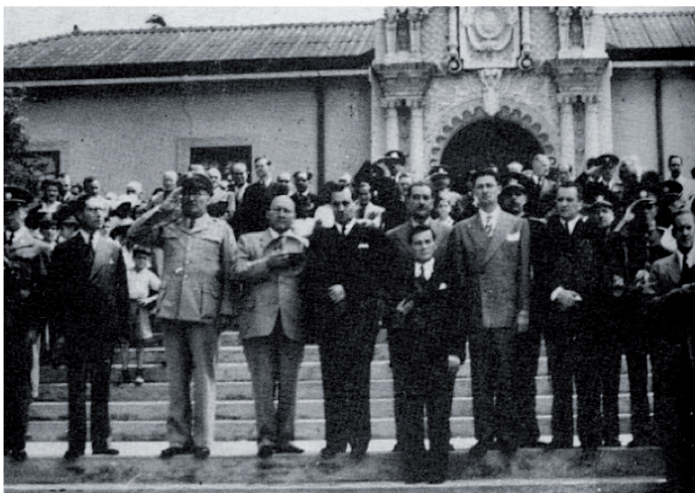
Figura 2. Recepción oficial llevada a cabo en la Casa Amarilla. 8 de mayo, 1940.

En ninguna oportunidad se ha visto una recepción como la de ayer en la Casa Amarilla. Miles de ciudadanos, desde el encoquetado capitalista y hombre de la ciudad, hasta el humilde patillo, acudieron confundidos en un mismo anhelo patriótico, a testimoniar al doctor Calderón Guardia su simpatía y profundo afecto. Fue una demostración palpable de que el nuevo mandatario llega al poder rodeado del sincero cariño de la inmensa mayoría de los costarricenses. (“En medio de gran júbilo”, 1940).