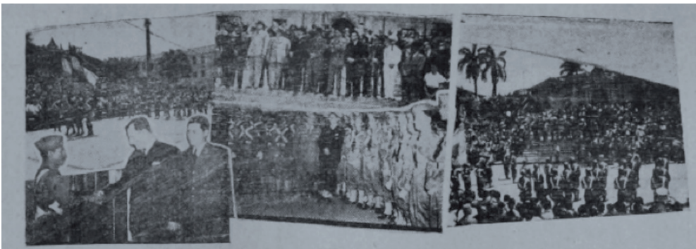
Figura 4. Fotografías de la recepción oficial llevada a cabo en la Casa Amarilla, publicadas por La Tribuna . Mayo, 1944.

Al finalizar el acto de juramentación, Teodoro Picado y el resto de las autoridades políticas asistieron a la Catedral Metropolitana para la celebración del Te Deum. Al concluir el acto religioso, el nuevo presidente ofreció una recepción en la Casa Amarilla, a la cual aparte de las delegaciones extranjeras y autoridades de Gobierno, acudió una concurrida multitud para presenciar cómo estas daban sus saludos al nuevo mandatario (ver figura 4).