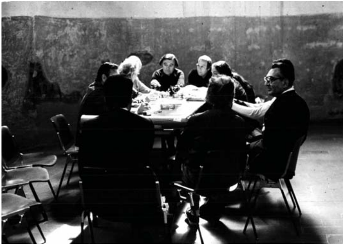
(Fig 1) Team 10 en Spoleto, 1976