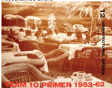
(Fig. 7) Primera publicación de Team 10 Primer en Architectural Design n°12, diciembre 1962. Portada