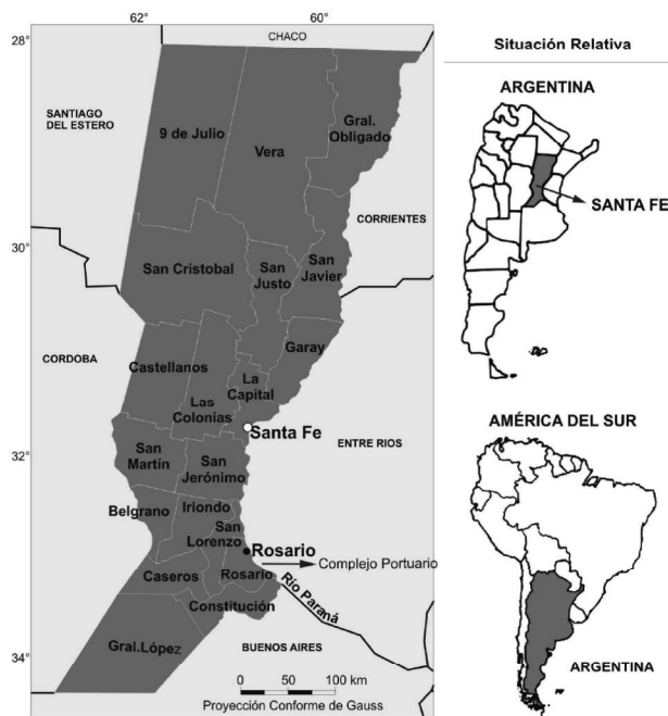
Figura 1. Localización del área de estudio

El área de estudio (Figura 1) estuvo integrada por 19 departamentos administrativos de la provincia de Santa Fe, Argentina, localizada entre los 28° y 34°23' Sur y entre 58° 53'y 62° 53' Oeste. Según datos oficiales en 2010, la Provincia tenía 3.194.537 habitantes y ocupaba el tercer lugar, luego de Buenos Aires y Córdoba, en volúmenes de producción y superficie ocupada por el cultivo de soja. Asimismo, poseía la mayor cantidad de industrias procesadoras de aceite, uno de los mayores polos de exportación de soja; se añade que uno de los nodos de crecimiento más importante del país es Rosario y el Gran Rosario, situado en la margen occidental del Río Paraná con gran tránsito fluvio-comercial y nexo conector de la denominada región núcleo argentina. Las condiciones enunciadas hacen de Santa Fe, un territorio donde la población rural se encuentra inmersa en una matriz productiva-sojera con riesgos potenciales para su salud.