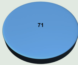
Gráfica 2. Generación eléctrica renovable en México, 2013. Participación porcentual por tipo de fuente primaria

Fuente: elaboración propia con base en El Economista, 2013a.