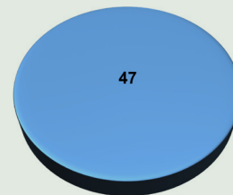
Gráfica 1. Generación eléctrica en México, 2010. Distribución porcentual por fuente primaria de energía