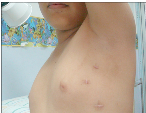
Figura 4. Cicatriz toracoscopía videoasistida.