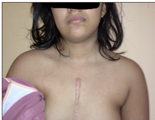
Figura 3. Cicatriz de esternotomía media.