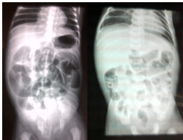
Figura 1. Radiografía simple de abdomen. Se observa asas intestinales apelonadas, con edema interasas y niveles hidroaéreos.

En la radiografía simple de abdomen se observan asas intestinales apelonadas, con edema interasas, nivel hidroaéreo, no se observa aire en la ampolla rectal (figura 1).