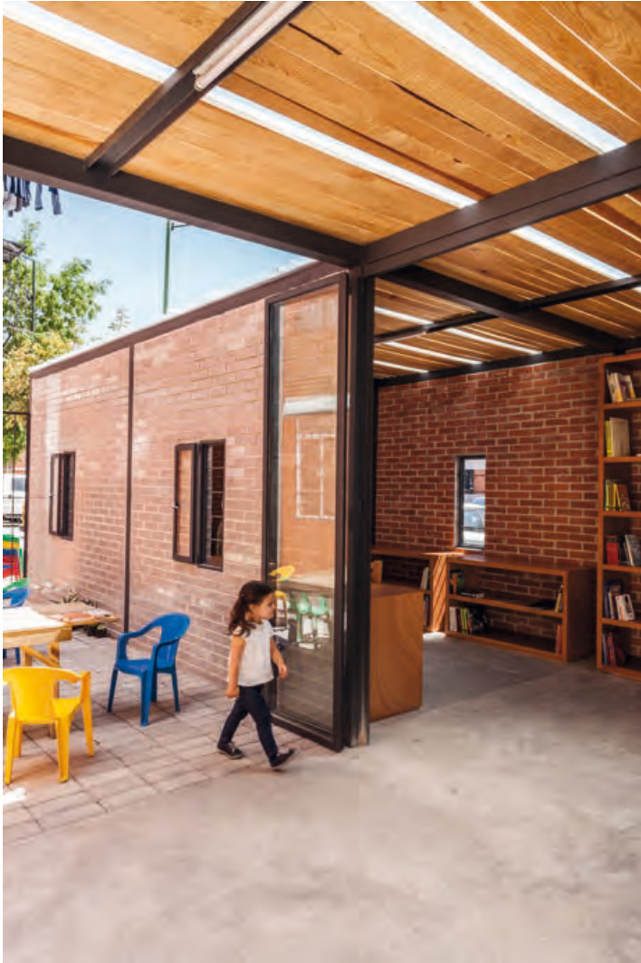
Pequeña biblioteca comunitaria sustituyendo un antiguo cobertizo de autoconstrucción.