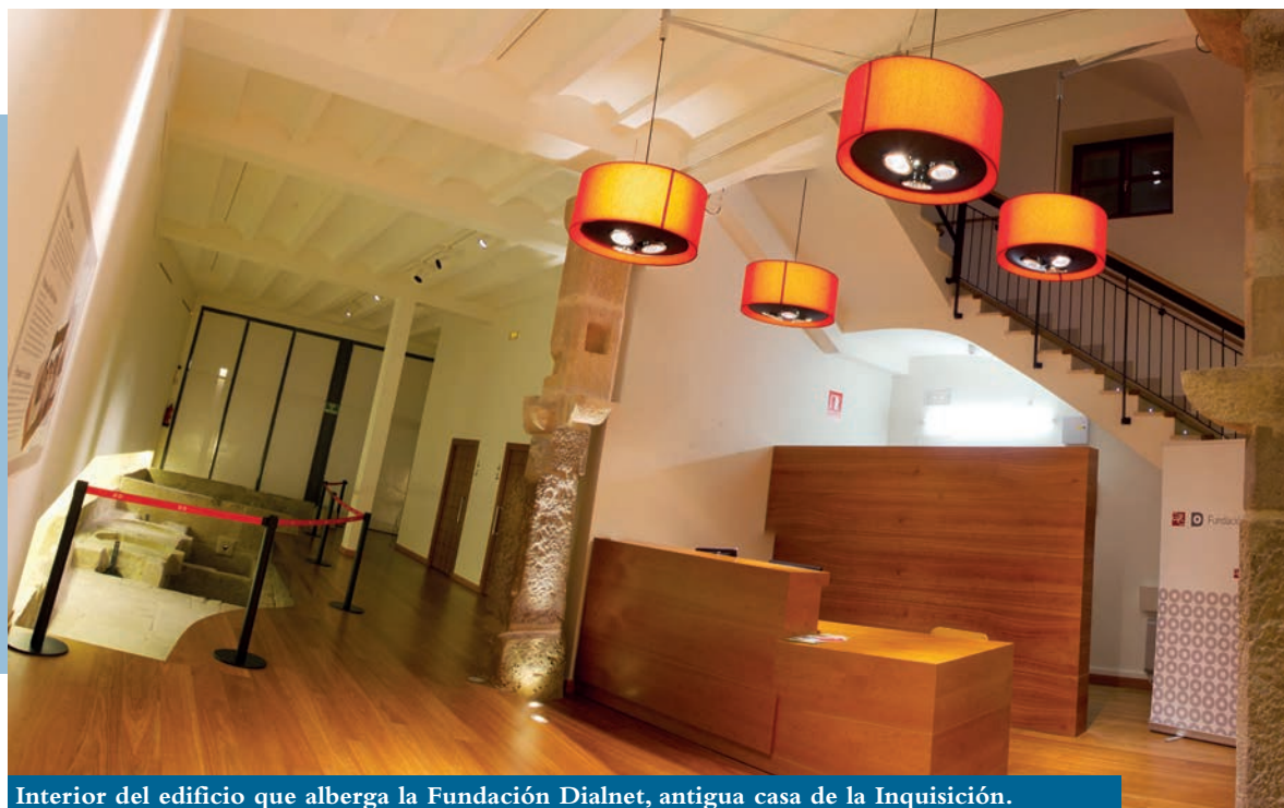
Interior del edificio que alberga la Fundación Dialnet, antigua casa de la Inquisición.

Isaac Newton, por ejemplo, publicó en el año 1672 y en las citadas Philosophical Transactions su trabajo relativo a que el color es una propiedad inherente a la luz.