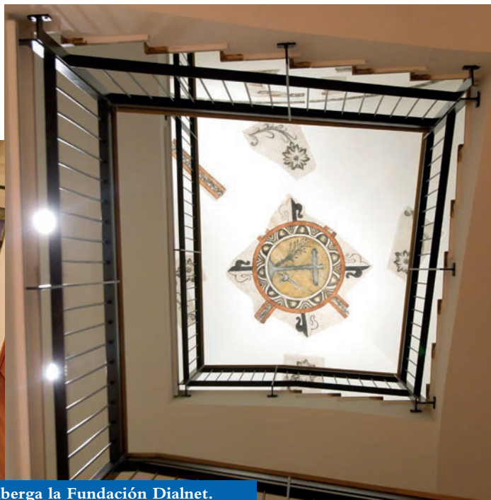
Interior del edificio que alberga la Fundación Dialnet.

la calle Barriocepo, número 10, de Logroño (La Rioja). Como curiosidad histórica, en ese mismo lugar estuvo el llamado Hospital de Rochamador o Rocamador que sería sede del Tribunal de la Inquisición a partir de su traslado desde Calahorra a Logroño en 1570.