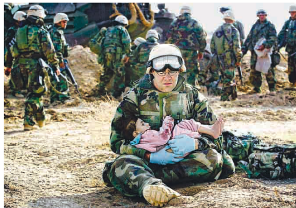
CROSS-FIRE A marine doctor held an Iraqi girl yesterday after her mother was killed by cross-fire on the front line near Rifa, American officers said.