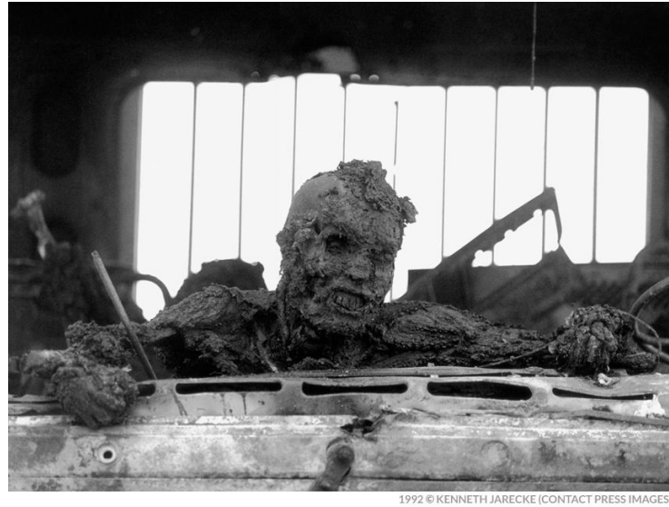
Figura 4. Kennet Jarecke: Nasiriya, Irak 1991