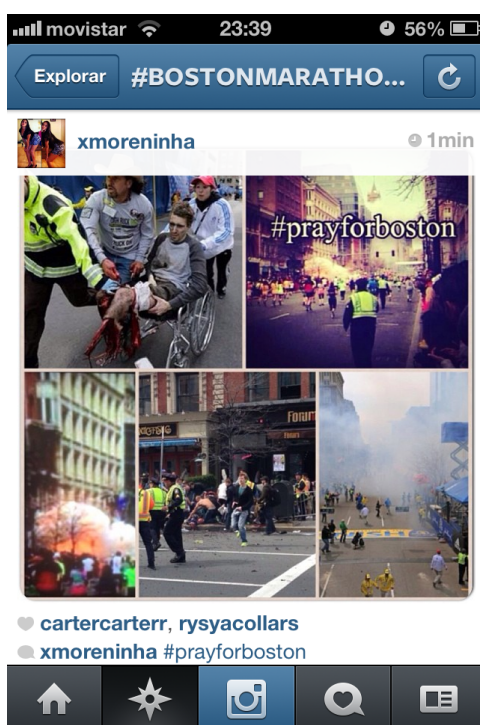
Figura 5. Imágenes del atentado en la maratón de Boston en redes sociales

Cualquiera que tenga un smartphone puede ya manipular, editar e incluso publicar y difundir en las redes sociales lo que acaba de ocurrir. Por ejemplo podemos citar el atentado ocurrido en la maratón de Boston el 15 de abril de 2013, tan sólo unos minutos después de suceder, las redes sociales ya mostraban cientos de imágenes tan duras como esta: