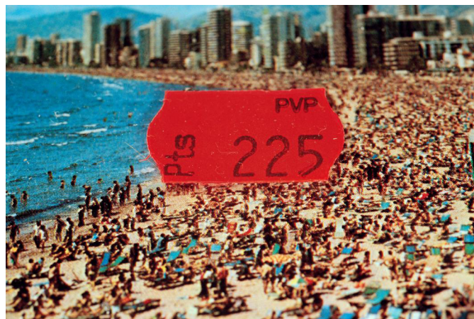
Figura 2. Martin Parr: Benidorm, 1997.