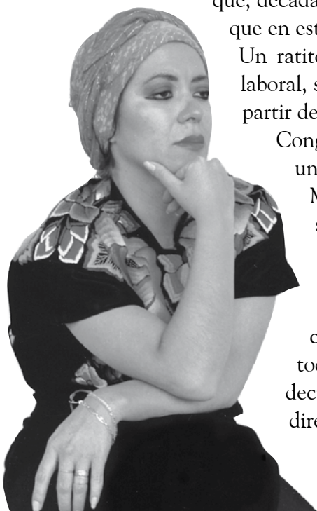
LA COLMENA 68, enero-marzo 2011

De esa fase dos programas registro particularmente: un radioteatro que hicimos basándonos en el Cuento de Navidad de Charles Dickens, donde participó