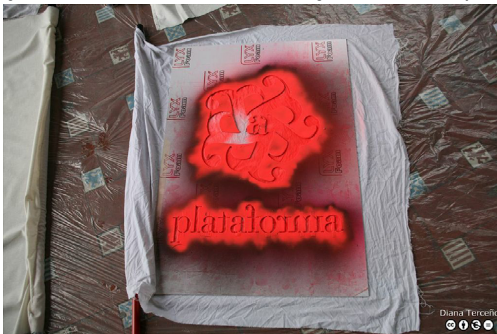
Figura 2. Plantilla para las banderas utilizadas en la acción «ASALTA», Bilbao 18 de mayo de 2013.

Para la acción realizamos una plantilla de gran tamaño con el logotipo de la plataforma que pintamos en las banderas (fig. 2), así como 7 modelos diferentes de pegatinas que utilizamos en distintos centros culturales y museos que adolecen de una notoria asimetría en la incorporación de artistas mujeres.