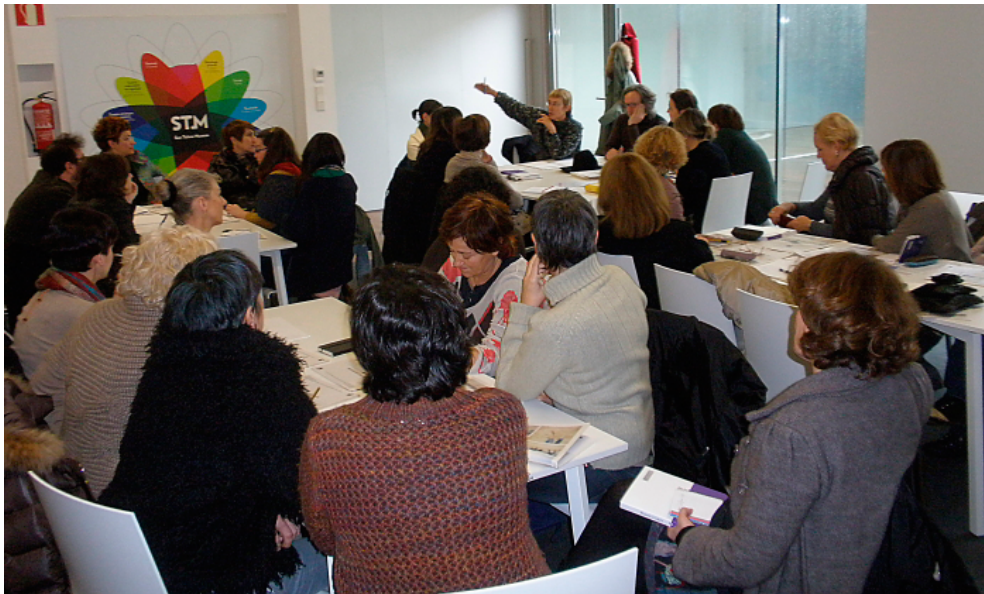
Figura 13. Primer encuentro de Plataforma A. Museo San Telmo, San Sebastián, 24/01/2012.

En el segundo encuentro la plataforma se plantea dejar de estudiar el problema sociológicamente y actuar. El primer paso que se acuerda es hacer presión sobre las administraciones públicas, redactando un documento «manifiesto» para la aplicación de la ley en el que adoptamos dos líneas de acción: