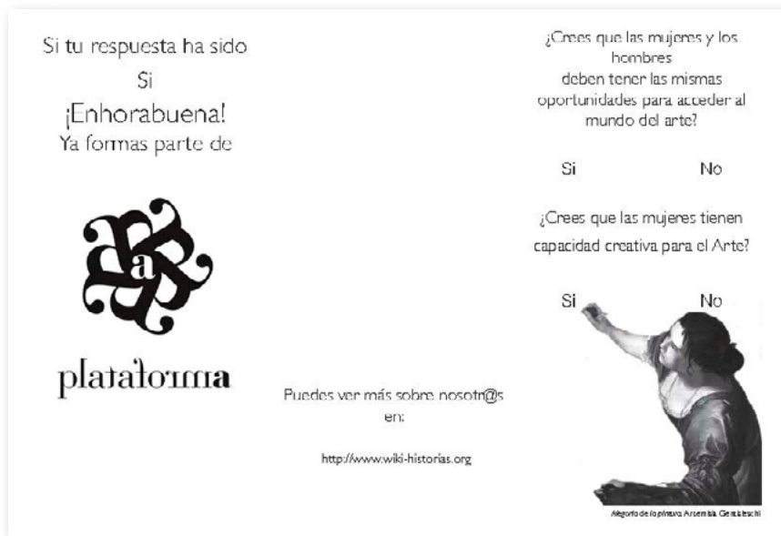
Figura 10. Tríptico para doblar utilizado en la sesión informativa en la Facultad de Bellas Artes de la Universidad del País Vasco, Leioa, 18 de febrero de 2015.

patrones comportamentales y aspiracionales. Sin embargo, haciendo balance, pareciera que en este reparto, las mujeres tuvieran más las de perder. 12