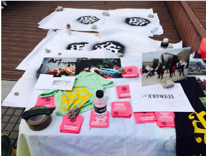
Figura 21. Presentación y taller de stencils en Donostia/San Sebastián, 17 de mayo 2015.

En el octavo encuentro ideamos la acción «BRINDIS», una acción de carácter positivo para reivindicar que se cumpla la Ley de Igualdad en las Artes.