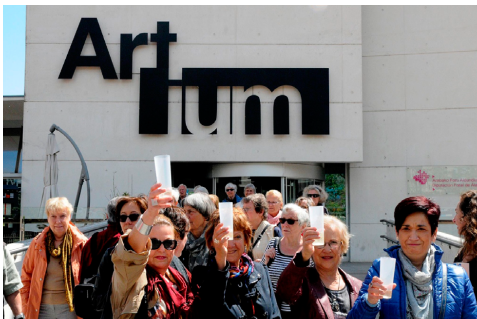
Figura 5. Acción «BRINDIS», Vitoria-Gasteiz, 17 de mayo de 2014.