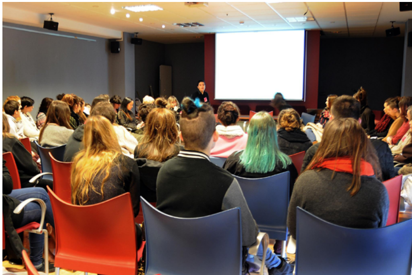
Figura 9. Sesión informativa de la Plataforma A en la Facultad de Bellas Artes de la Universidad del País Vasco UPV/EHU, tras la acción «TÚ NO», Leioa, 18 de febrero de 2015.

En el material para la preparación de la acción TÚ NO , la artista Saioa Olmo explica el contexto para la acción: