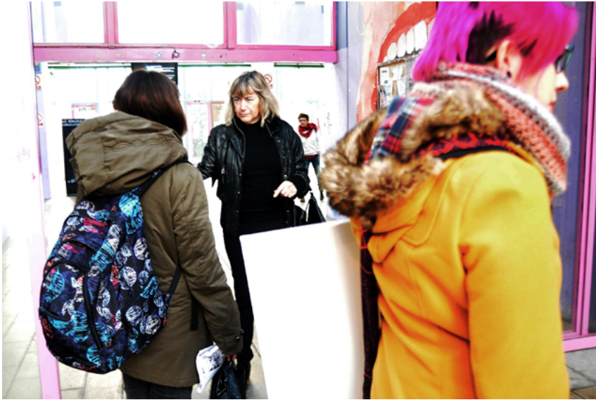
Figura 7. Acción «TÚ NO», Leioa, 18 de febrero de 2015.

nales de discriminación de género. Se trataba de una acción camuflada por lo que no fue anunciada como acción artística.