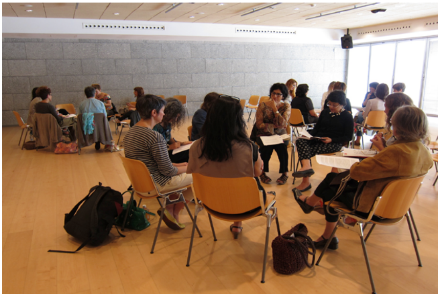
Figura 15. Tercer encuentro de Plataforma A, Artium, Vitoria-Gasteiz (15/09/2012).