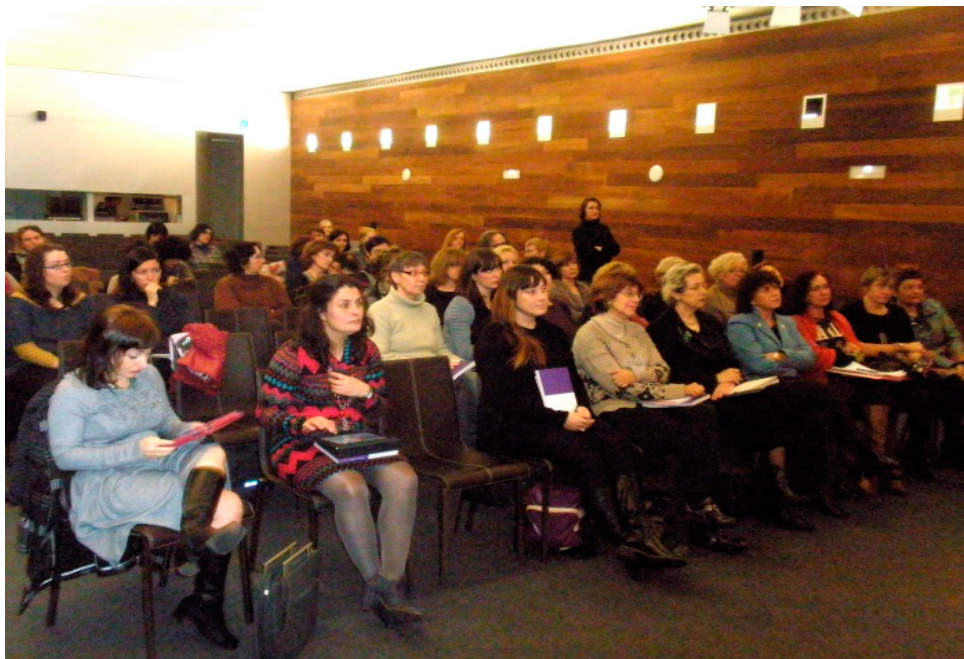
Figura 12. Primer encuentro de Plataforma A. Museo San Telmo, San Sebastián, 24/01/2012.

Al primer encuentro, realizado en enero de 2012 en San Sebastián, se hizo un repaso de la Ley de Igualdad, asisten la Consejera de Cultura Blanca Urgell y la técnica de igualdad, Sonia González, ambas del Gobierno Vasco, y se comprometen a traer sus informes de participación para el próximo encuentro.