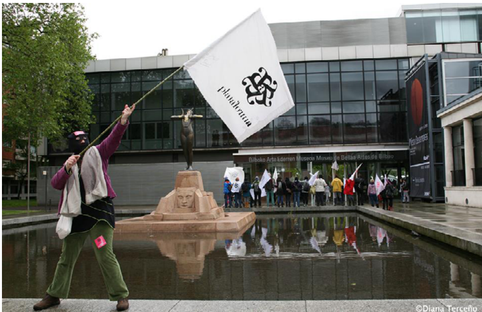
Figura 4. Acción «ASALTA», Bilbao, 18 de mayo de 2013.