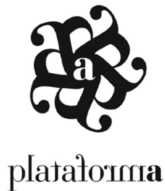
Figura 19. Logotipo de Plataforma A, diseñado por iniciativa de una de las miembros de Plataforma A con la colaboración de la Escuela de Arte y Superior de Diseño de Vitoria-Gasteiz. Diseño: Ion Romero.