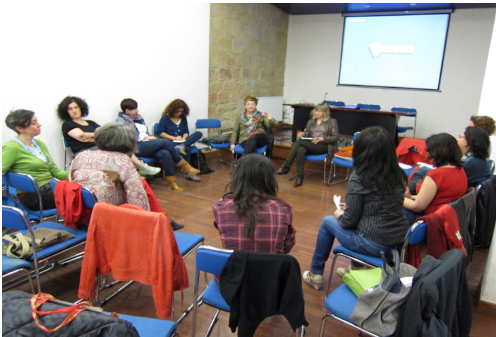
Figura 20. Quinto encuentro de Plataforma A, Distrito de la Bolsa, Bilbao (11/05/2013).

En el sexto encuentro, participamos a toda la Plataforma A la noticia de que el Gobierno vasco por medio del defensor del pueblo y Emakunde (Instituto Vasco de la Mujer) nos ha pedido que participemos en la redacción del VI Plan de Igualdad del Gobierno Vasco (2014-2018).