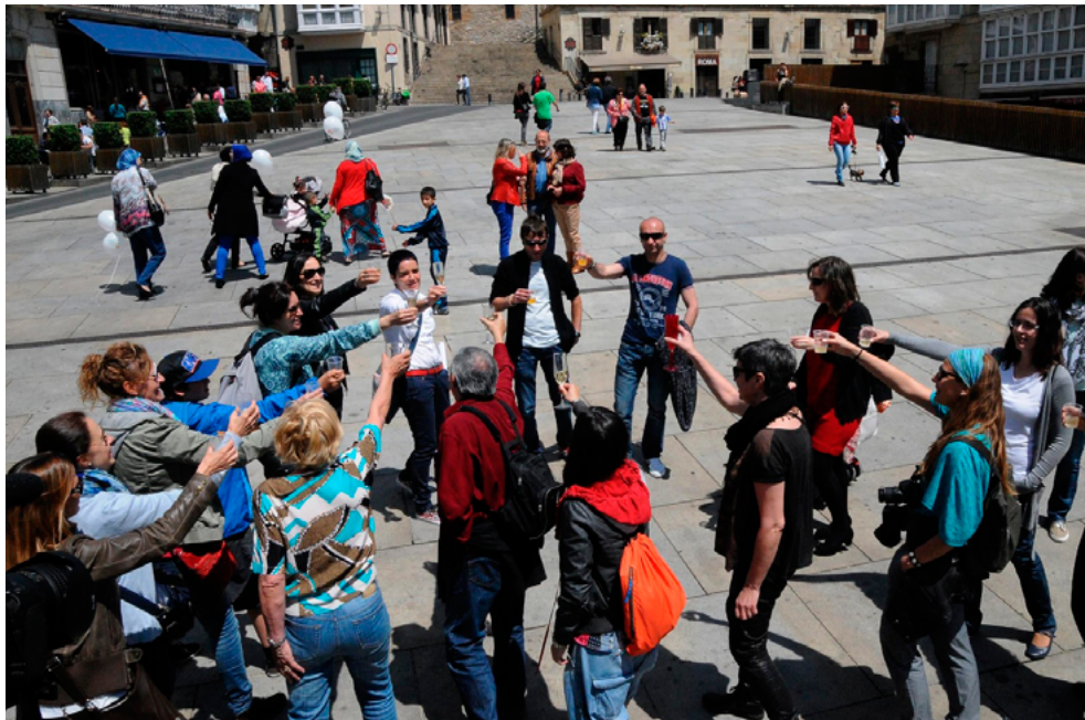
Figura 6. Acción «BRINDIS», Vitoria-Gasteiz, 17 de mayo de 2014.