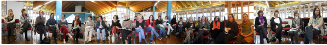
Figura 14. Segundo encuentro de Plataforma A, La Bolsa, Bilbao (21/04/2012).

En el tercer encuentro realizado en Vitoria-Gasteiz en septiembre de 2012, se considera crear una recogida de firmas en Change.org y se decide crear una imagen corporativa de Plataforma A, como trabajo real de los/las estudiantes de la Escuela de Diseño, adaptada a medios online y offline .