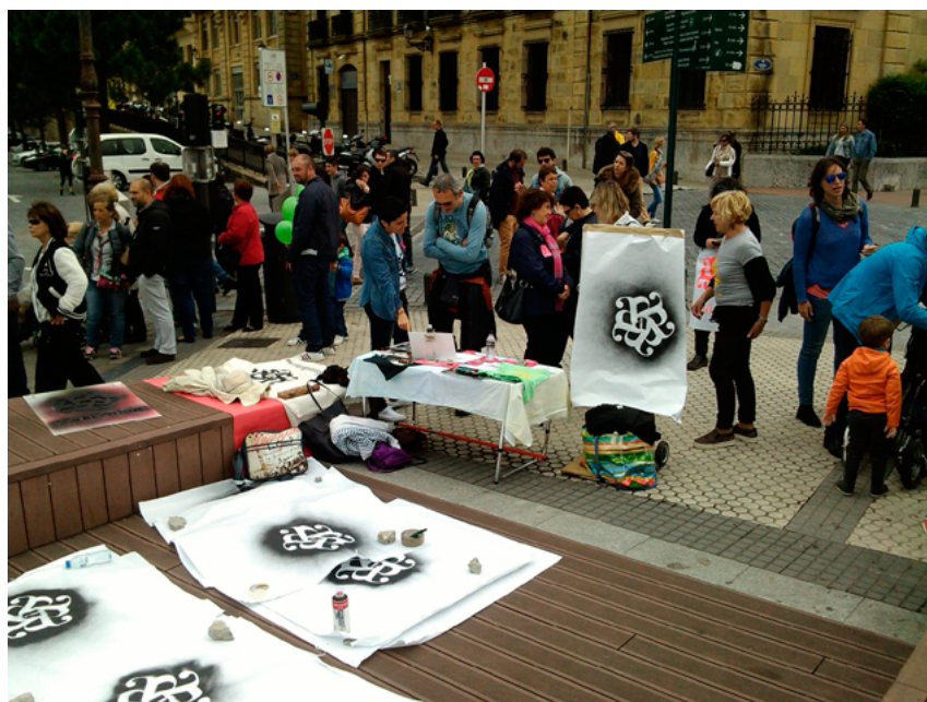
Figura 11. Sesión informativa «ENTÉRATE» realizada en San Sebastián el 18 de mayo de 2015. Fotografía: Txaro Arrazola.