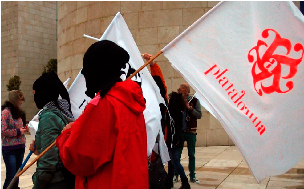
Figura 3. Acción «ASALTA», Bilbao 18 de mayo de 2013.