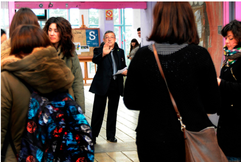
Figura 8. Acción «TÚ NO», Leioa, 18 de febrero de 2015.