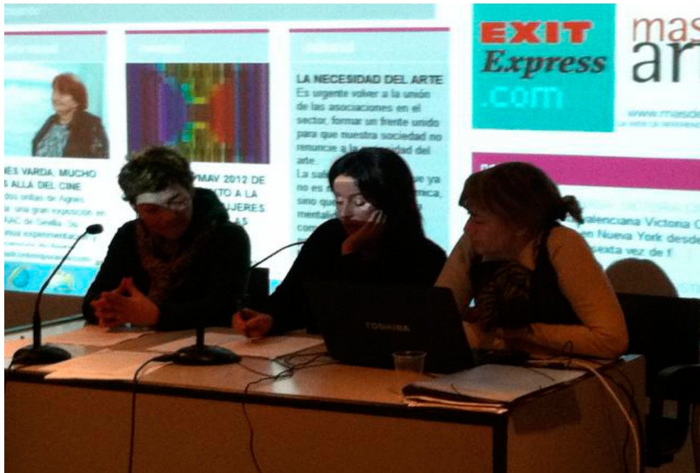
Figura 17. Conferencia de Plataforma A en Feministaldia, Arteleku, San Sebastián (15/12/2012).

En el cuarto encuentro se repartieron tareas para la siguiente sesión señalando la importancia de que estas tareas fueran rotando: