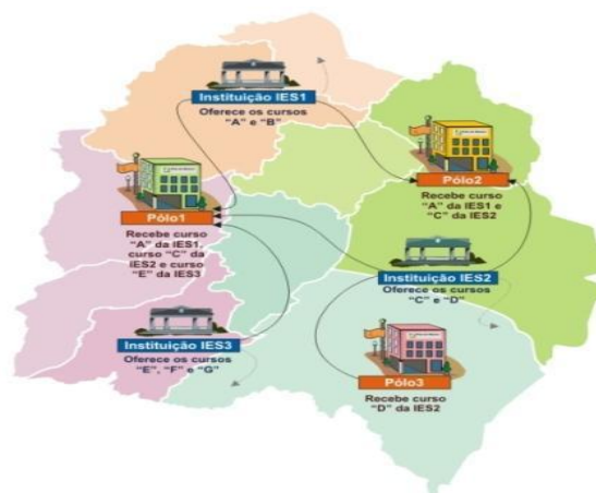
Figura 2: Funcionamento do sistema UAB (Fonte: Própria).

Essa articulação estabelece qual instituição de ensino deve ser responsável por