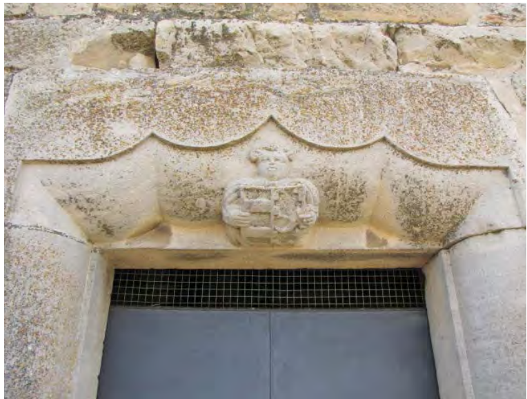
Figura 6. Exemple d'un altre personatge sostenint un escut en un altre punt del castell.

El plomatge es presenta de manera molt més esquemàtica que les ales de l'àngel custodi. En aquest cas, s'opta per un trac-