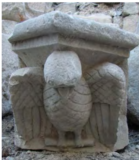
Figura 7. Permòdol amb la representació d'una au.

tament romboïdal de la superfície i del final de les ales de manera molt esquemàtica.