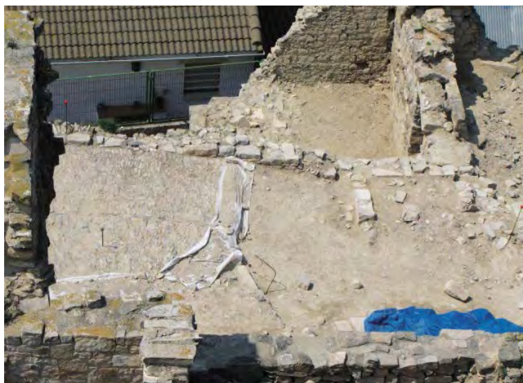
Figura 3. Vista aèria de l'empedrat a dos vessants localitzat en el sector 11.