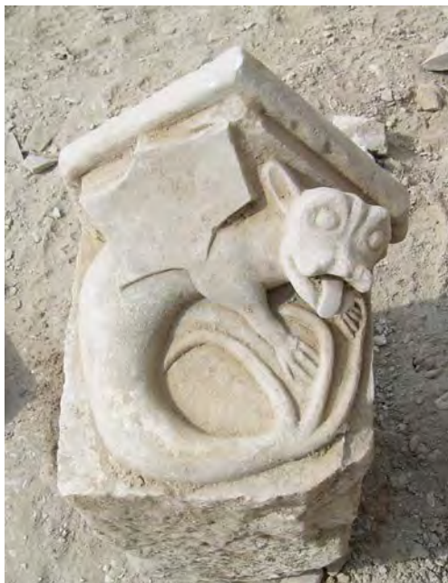
Figura 8. Permòdol amb la representació d'un drac.

uns ulls circulars esculpits amb volum i una boca oberta sense dentadura, amb la llengua totalment fora. Les orelles d'aquest animal recorden les d'un ratpenat, més aviat allargassades. És una figura alada, però la representació de l'ala dreta, l'única que podem observar, és molt esquemàtica, amb un hexàgon que li surt per sobre de l'extremi-