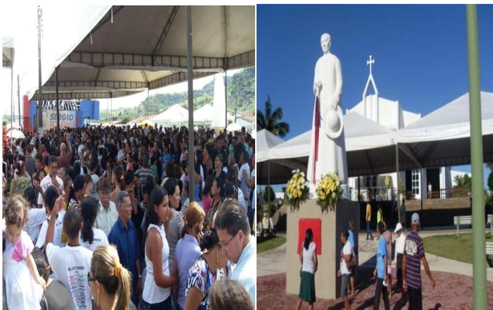
Figuras 03 e 04: Missa do dia 20 e Monumento do Padre Cícero.

Com efeito, essas características peculiares de cada lugar como demonstra Santos, nos levam a uma compreensão do destino de Boca da Mata pelos devotos de Padre Cícero (figuras 03 e 04). Qual o diferencial de Boca da Mata para receber quase dez mil devotos em sua tradicional missa: Acolhida paroquial? Tradição? Ou as belezas naturais da cidade?