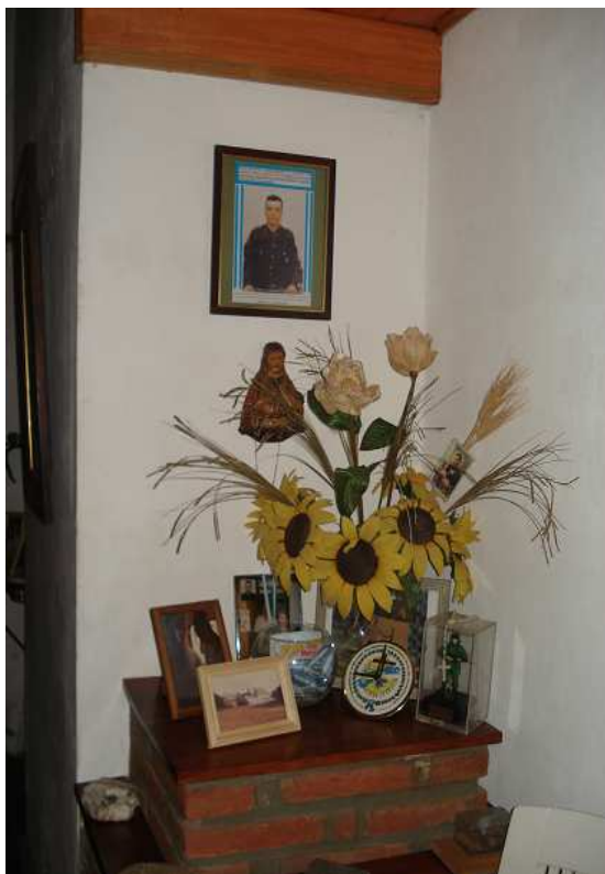
Imagen Nº 2. Altar doméstico de la Familia Araujo, Colón, Entre Ríos.