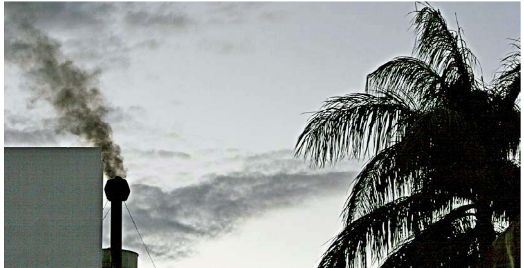
Alfredo Huerta. Industria emisora de dióxido de carbono, San José.

lo establece la norma 12-01-06-2011, la condición de carbono-neutralidad se logra cuando, a través de un proceso transparente de medición de las emisiones (e), el resultado neto de las emisiones menos las reducciones y/o remociones internas (r), menos la compensación (c) debe ser igual a cero, expresado de acuerdo con la siguiente ecuación: