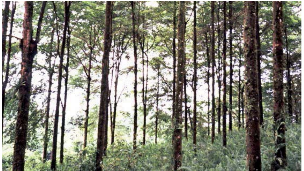
Eric Gay. Plantación forestal fijadora de carbono, Costa Rica.

En resumen, si sumamos la incertidumbre en el cálculo del carbono por árbol por el hecho de utilizar factores de la literatura (FC, FEB, Br/Bat) y los extrapolamos a la hectárea, la cifra final está bastante alejada de la realidad. A esto debe agregársele el carbono no cuantificado en la necromasa, en la vegetación herbácea, en los productos de la madera y en el suelo. Es así como la selección de ecuaciones alométricas, factores