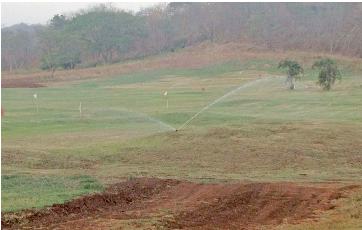
Figura 1. Riego de un campo de golf en Guanacaste durante la época seca en 2013.

otros largos once meses más” (Muñoz de Escalona, 2007, pág. 28).