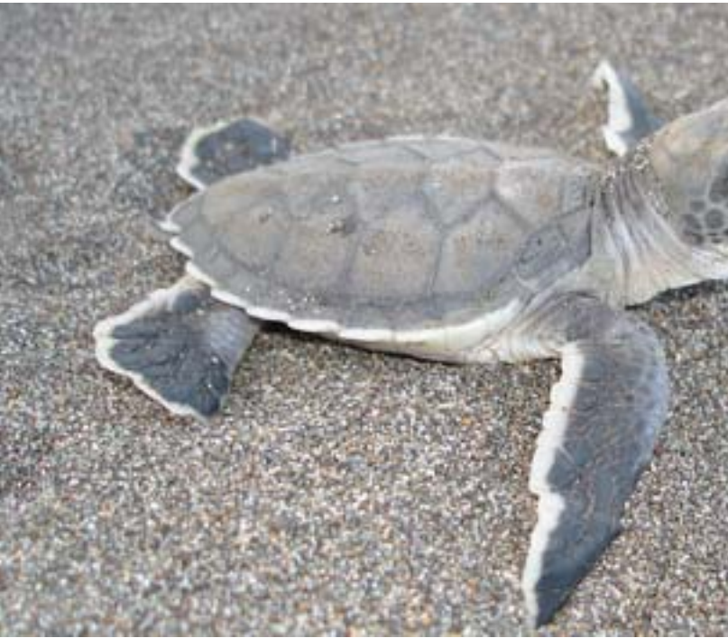
Eric Gay. Tortuga verde ( Chelonia mydas )