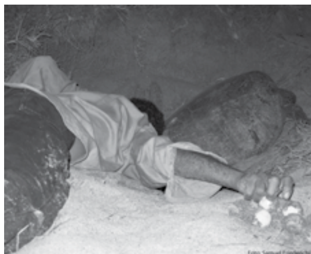
Figura 3. Práctica frecuente en playa Nombre de Jesús. Extracción de huevos durante el proceso de desove de una tortuga negra ( Chelonia mydas ).

El ecoturismo puede representar una fuente de ingreso para las comunidades cercanas a playas de anidación de tortugas marinas (Tisdell y Wilson, 2002). Cuando esta práctica es realizada de forma organizada, contribuye al conocimiento y a la educación acerca de especies en peligro de extinción, lo cual compromete a turistas de diferentes lugares del mundo con la conservación (Tisdell y Wilson, 2005). Este no es el caso de las playas de Guanacaste, donde el turismo sin control afecta altamente a las tortugas negras. Generalmente, las tortugas retornan a la playa sin anidar o suspenden el nido y vuelven al mar todavía cargando huevos con cáscara en el oviducto. Si bien las tortugas marinas tienen la capacidad de mantener huevos por largos periodos (Casares et al. , 1997; Plotkin et al. , 1997), estas vuelven a la playa la misma noche o la noche siguiente, ya sea para desovar el nido completo o para desovar los huevos restantes. Esto causa un mayor gasto energético que el necesario para una temporada de anidación y puede impactar en el número total de nidos que desovará la tortuga en una tempora-