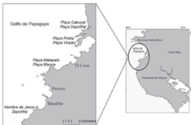
Figura 1: Playas de anidación de tortuga negra o verde del Pacífico ( Chelonia mydas ) en Guanacaste. Las playas recorridas que presentaron un número importante de “camas” de tortuga negra (> 50 posibles nidos) son Nombre de Jesús, Zapotillal, Matapalo, Blanca, Prieta, Virador y Cabuyal.

Durante los recorridos de playas, el mayor impacto registrado fue la recolección ilegal de huevos. Esta actividad fue observada principalmente en las playas Matapalo y Cabuyal, donde aproximadamente el 50% de los nidos se encontraba excavado al momento de la observación. El desarrollo también es un factor que impacta