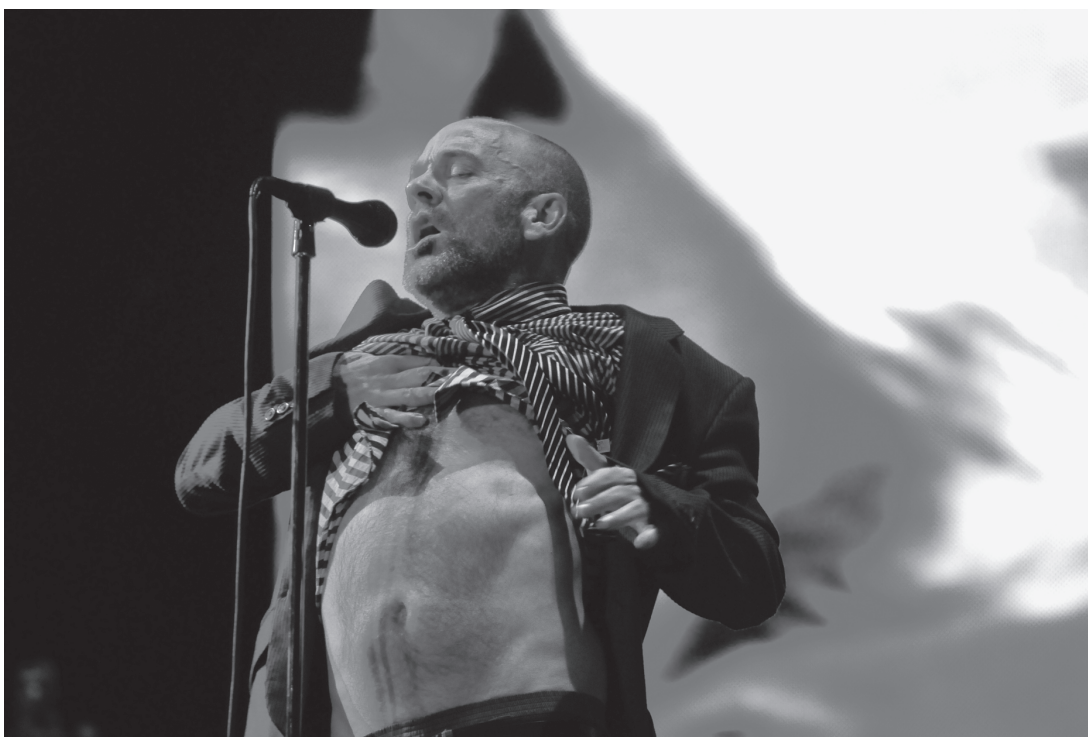
REM, Club Ciudad de Buenos Aires, Buenos Aires, 1 de noviembre de 2008.