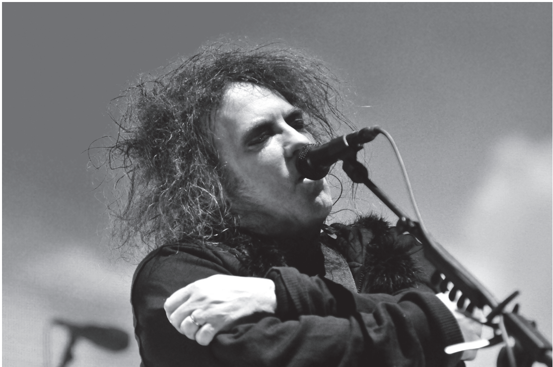
The Cure, Estadio de River, Buenos Aires, 12 de abril de 2013.