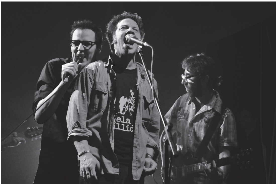
Buenos Muchachos y The Supersónicos, La Trastienda, Montevideo, 14 de setiembre de 2012.