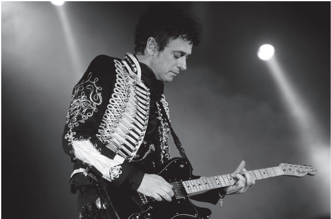
Gustavo Cerati, Velódromo Municipal, Montevideo, 5 de diciembre de 2009.