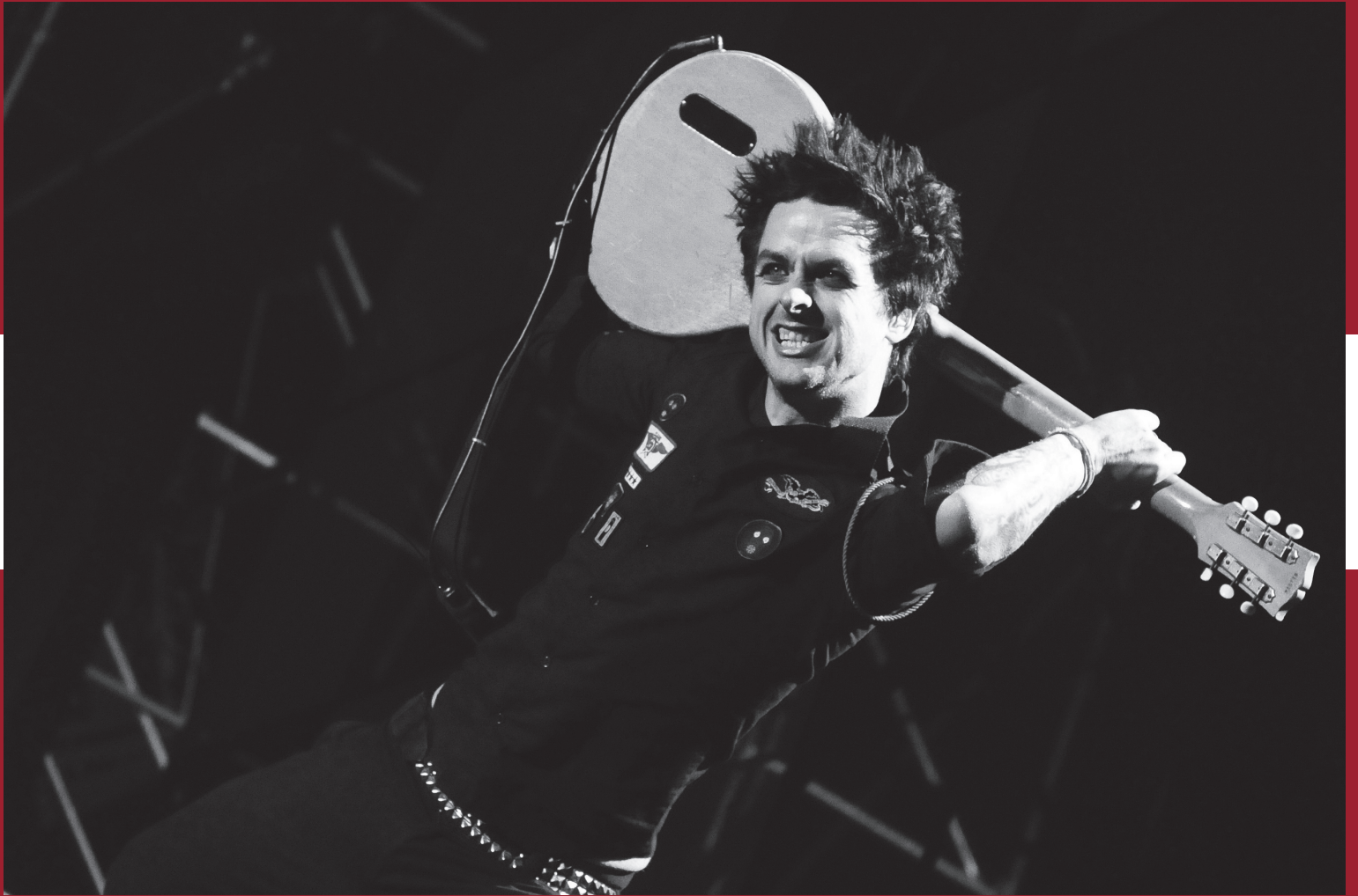
Green Day, Costanera Sur, Buenos Aires, 22 de octubre de 2010.