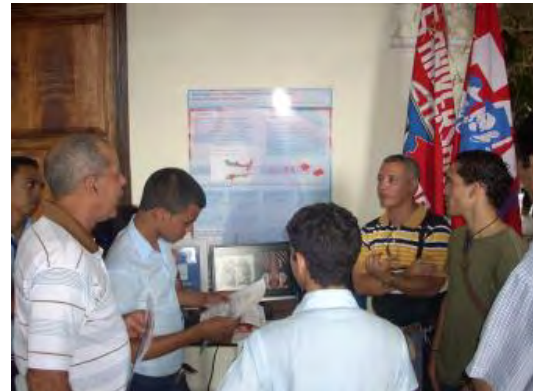
Vista de la expo del Centro de Biofísica Médica

Se estableció en el segundo piso del Centro de Información y Gestión Tecnológica [MEGACEN] y desde su inauguración se han presentado ocho exposiciones [[Resultados del Centro de Biofísica Médica, Aplicación del electromagnetismo a la salud, la agricultura y la industria [Centro Nacional de Electromagnetismo Aplicado]], La Sismología y la Meteorología al servicio de la sociedad, 50 años de la Universidad de Ciencias Médicas, entre otros.