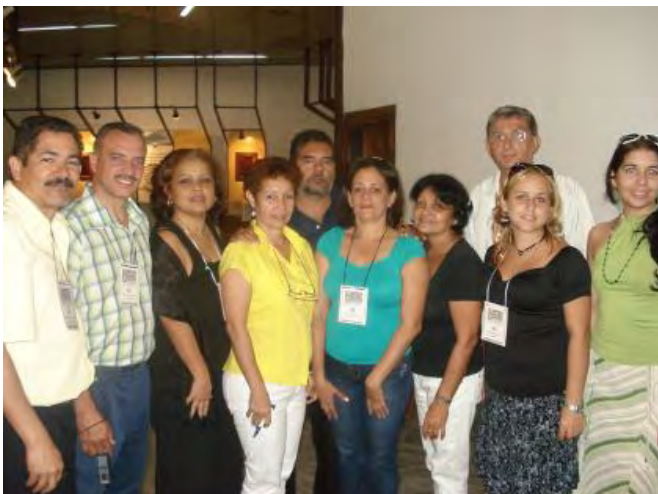
Círculo de la prensa, junto al autor del trabajo [ext. izq.], en Salón de los Vitrales de Santiago de Cuba, Simposio de Comunicación Social.

El Consejo de Comunicación de Santiago de Cuba está integrado por 12 especialistas que representan a los centros de ciencia y servicios científico – técnicos de la provincia, dirigidos por el especialista principal de la Delegación Territorial. Tiene la peculiaridad de que desarrolla sus actividades mensuales en un centro diferente cada mes con el objetivo de que los centros sede [del CITMA y la provincia en general] presenten la historia, estructura, membresía y resultados fundamentales, como una forma de “poblar” la cultura de los especialistas con los aspectos más esenciales de la historia y presente de la cultura científica territorial.