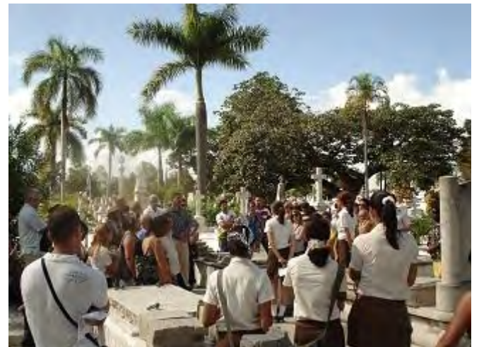
Panorámica del primer recorrido por el Sendero de las Personalidades en el cementerio Santa Ifigenia.

Este recorrido es asumido con más compromiso por las instituciones y organizaciones y tiene la particularidad, de que a él se han involucrado a estudiantes de preuniversitario integrados en una sociedad científica dedicada al estudio de las Personalidades de las Ciencias y a su presentación en el sendero descrito.