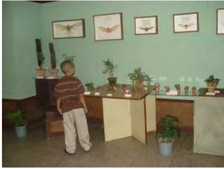
Vista del Museo Tomás Romay