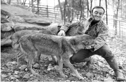
Félix Rodríguez de la Fuente- realizador de documentales para radio y televisión, destacando entre ellos la serie El Hombre y la Tierra [1974-1980].