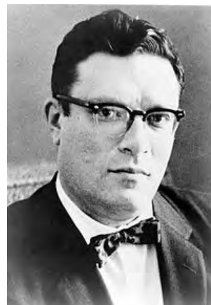
Isaac Asimov [1920-1992] Escritor y bioquímico autor de obras de Ciencia ficción, historia y divulgación científica.

Entre los divulgadores de la ciencia y la tecnología que tienen un espacio muy distinguido en las publicaciones científicas y que además, merecen un estudio para que nos sirva de referentes en la formación de nuevos divulgadores científicos, se pueden mencionar a Isaac Asimov, quién tiene un destacado reconocimiento en la divulgación de la astronomía y otras disciplinas científicas; Martin Gardner, destacado en la publicación de artículos de divulgación de las matemáticas. Nos resulta de mucho placer mencionar a Félix Rodríguez de la Fuente, que marcó una época en la televisión cubana [e internacional] con el programa El Hombre y la Tierra. Por su parte, Carl Sagan, fue el divulgador de la serie de televisión/el libro Cosmos: Un viaje personal, con la cual se asentó en la divulgación científica por derecho propio.