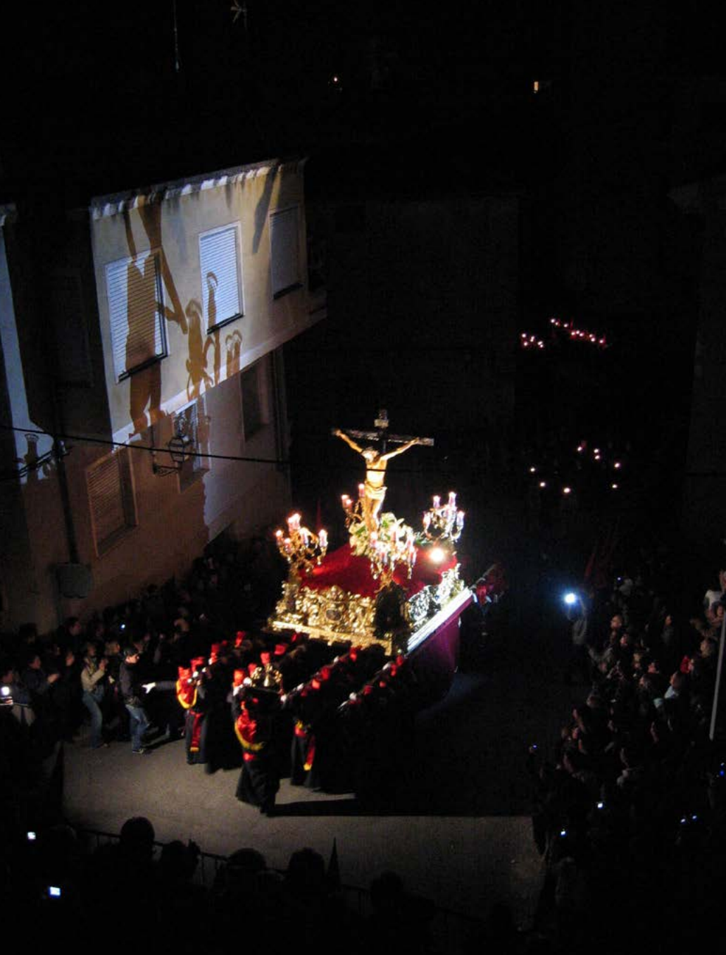
El Cristo pujant al carrer Fonament. Processó del Dijous Sant (5-4-2007).

ma d'art en què el costat profà i el religiós esdevenen inextricables, però una forma d'art embalsamada. Al final Calixto Bieito afirma que només tornaria a Sevilla "si el Cristo del Gran Poder desfilés amb el Rèquiem de Ligeti al pont de Triana."