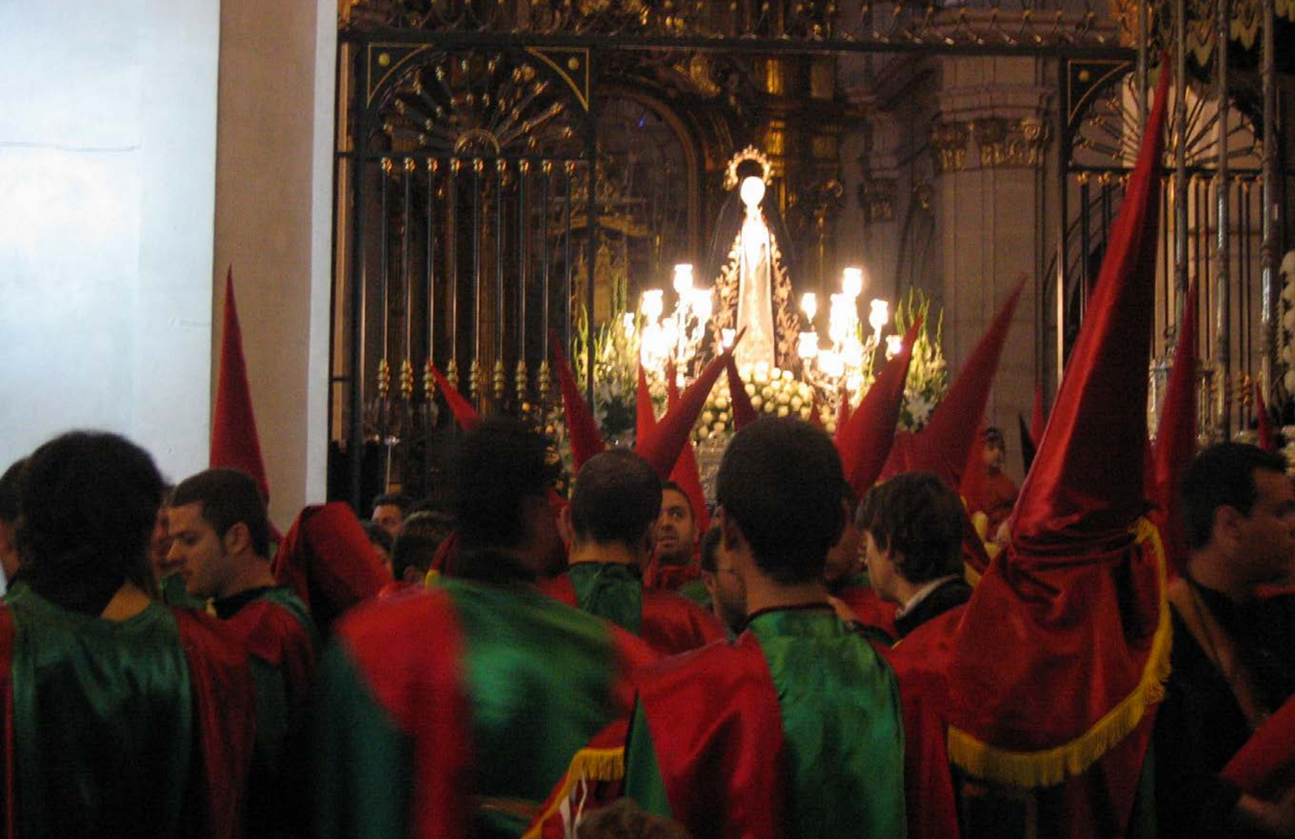
Confreres del Cristo davant de la Mare de Déu de la Soledat. Processó del Divendres Sant (6-4-2007).