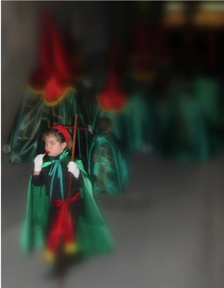
Xiquets del Cristo. Processó del Divendres Sant (21-3-2008).

nostra llengua tenia esta versió tan bella del diàleg entre l'àngel i les tres Maries: