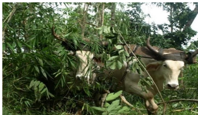
Figura 2. Obstáculos presentes en las pistas de arrastre en un aprovechamiento de plantaciones de Acacia mangium . San Carlos, Alajuela, Costa Rica. 2014.