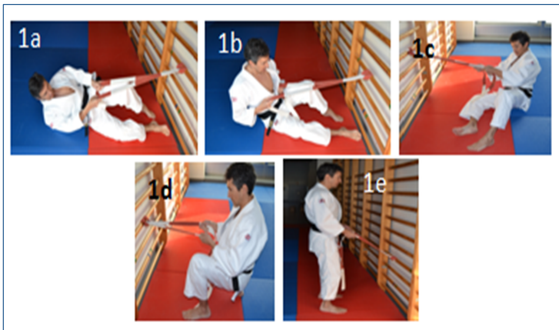
Fig.1 Yoko-ukemi asistido autónomo con implementos

La posición de partida será decúbito supino-lateral derecho (1a). El practicante sujeta el implemento con las manos y, apoyándose en él, realiza flexión lateral de cuello dirigiendo la mirada hacia el pie derecho. Este ejercicio tiene el objetivo de asimilar la posición final de la caída protegiendo la nuca del impacto frente a una caída lateral. Sobre la disposición material del ejercicio 1, y desde la posición final del mismo, contracción abdominal oblicua levantando la zona dorsal del suelo ayudándose de la tracción del implemento (1b). De este modo se minimiza el impacto al rodar por una superficie curva, no impactando los brazos contra el suelo. Sentado con piernas separadas a la anchura de los hombros (1c). El ejecutante, traccionando del implemento, realizará un desequilibrio sobre su lateral derecho iniciado por el cruce de la pierna derecha sobre la izquierda. Como situación final buscaremos acabar en la posición del ejercicio 2 tras rodar por el lateral derecho, desde la cadera, hasta el hombro. En cuclillas, piernas separadas a la anchura de los hombros y rodilla derecha apoyada en el suelo (1d). Sujetando el implemento con las manos, el ejecutante, realizará un desequilibrio sobre su lateral derecho. Una vez apoyada la cadera en el suelo por descenso del centro de gravedad, como situación final buscaremos acabar en la posición del ejercicio 3. Posición de pie