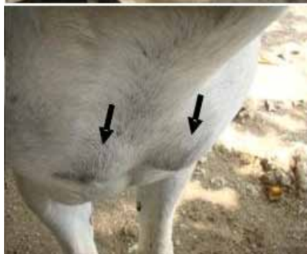
Figura 2. Aumentos de volumen (→) y edemas subcutáneos indurados en pared costal, abdominal y pectorales en un burro GSH-Px deficiente.