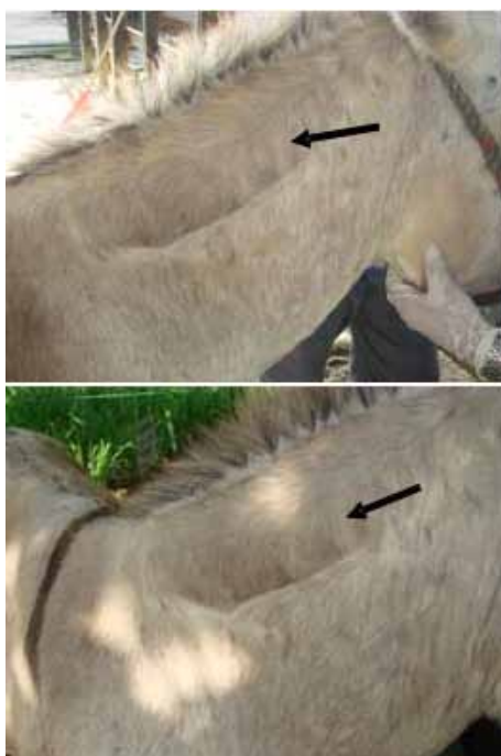
Figura 1. Marcado aumento de volumen de cuello (→) y de la cresta nucal en un burro GSH-Px deficiente.

Un burro criollo castrado, de 15 años de edad ingresó a las instalaciones de la Facultad de Medicina Veterinaria y Zootecnia de la Universidad de Córdoba, presentando ligamento nucal engrosado, duro y doloroso a la palpación, dando la impresión de un doble cuello (Figura 1), aumentos de volumen y edemas subcutáneos en