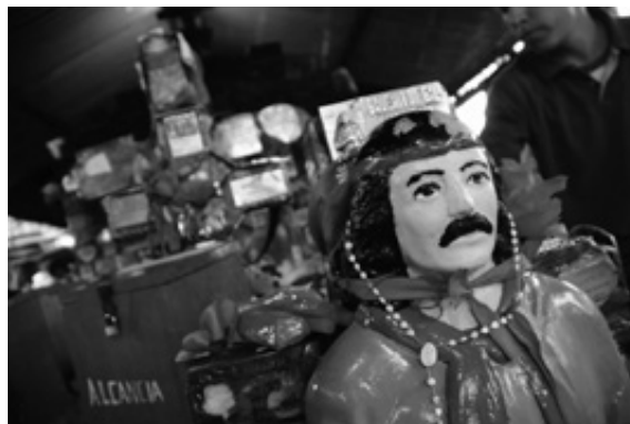
Figura 1. Escultura central del Gaucho Gil en el santuario de Mercedes.. Juan Pablo Faccioli 6 .

Antonio Mamerto Gil Núñez, hoy conocido como el Gauchito Gil, según los relatos orales fue un gaucho perseguido por desertar de la milicia en pleno enfrentamiento entre unitarios y federales durante el proceso de organización nacional, y también por estar acusado de robar a viajeros y terratenientes. Un milagro que habría realizado poco antes de morir (salvarle la vida al hijo moribundo de su ejecutor) y por repartir su botín entre los más necesitados dio origen a la leyenda del gaucho milagroso y justiciero.