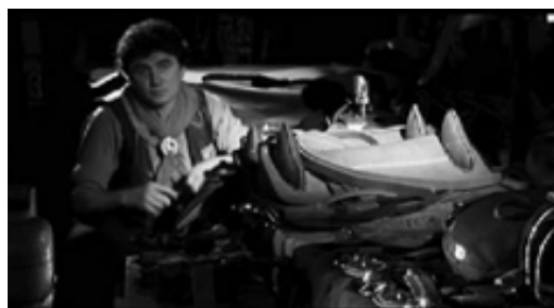
Figura 8. Fotograma del Film «El último refugio». Pablo Valente 55 .

danza, prácticas interacción personal) que posibilitan la memorización y la reproducción de códigos culturales y discursos vinculados con el arraigo y el desarraigo (figuras 8 y 9 54 ).