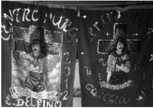
Figura 3. Foto del Centro Murga Gauchito A. Gil. S/T, Col. Murga. Disponible en el perfil público de Facebook.

la información y la comunicación cobran un rol preponderante en la visibilización de las expresiones de la cultura popular, y, entre ellas de las prácticas religiosas veladas en tiempos de la dictadura y aún más heterogeneizada en el contexto del inicio del nuevo milenio. Dicha visibilidad no es solo producto del discurso mediático tradicional que da lugar a estos relatos, con discursos aún muy marcados por los tonos despectivos y la consideración de los rituales de la religiosidad popular como superstición –visión marcada por el discurso eclesiástico–, sino también de las formas alternativas de comunicación.