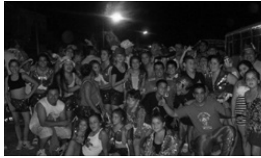
Figura 4. Foto Centro Murga Gauchito Gil. S/T. Col. Murga

Este complejo mundo cultural-comunicacional se desarrolla con fuerza desde los santuarios del Gaucho Gil, especialmente el situado a la vera de la ruta 123 en Mercedes y otros altares que proliferan a la vera de los caminos del país, y aquellos instalados en domicilios particulares; también se observa en los santuarios virtuales construidos por los devotos, donde se privilegia el intercambio de fotografías autorreferenciales, imágenes animadas, videos, intenciones, oraciones, recuerdos, comentarios, testimonios y foros con opiniones discrepantes.