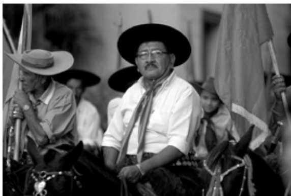
Figura 6. Los gauchos de Antonio Gil con indumentarias celestes y coloradas. Foto Guillermo Rusconi 47 .