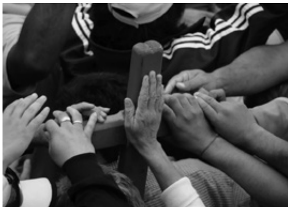
Figura 5. La cruz peregrina simboliza el cruzú Gil. Foto: Juan Pablo Faccioli 46 .

desde su época de oro –mediados del siglo xx–, la escuela, los medios, los archivos, etc.), pero también del gaucho correntino (que nombra en la provincia un símbolo del valor, del trabajo agrario, del coraje de los hombres que lucharon en las batallas de la independencia). Asimismo refiere a la organización social patriarcal y conservadora local (donde las posiciones de liderazgo principalmente están a cargo de los hombres de campo; ellos llevan la cruz, portan los estandartes distintivos y encabezan los desfiles y procesiones). Esto muestra lo que señala Caggiano: cómo los repertorios visuales hegemónicos postulan legitimidades y consagran jerarquías, posiciones y relaciones sociales 45 .