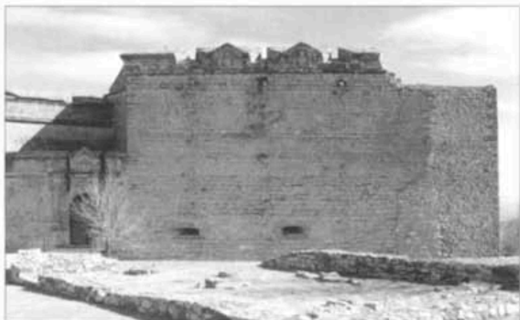
Castillo de Sabiote.

Campanario de la antigua Iglesia de la Virgen de la Villa: Al estilo de los "campanile" italianos.