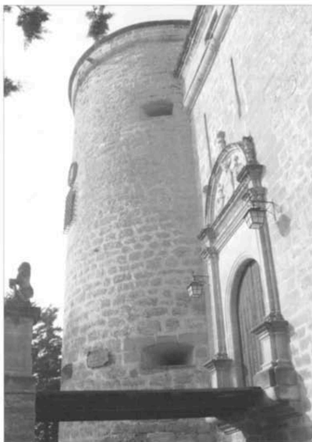
Castillo de Canena.

Hacienda del Pilar: Patio renacentista procedente del antiguo "Palacio del Marqués del Puente" de Andújar.