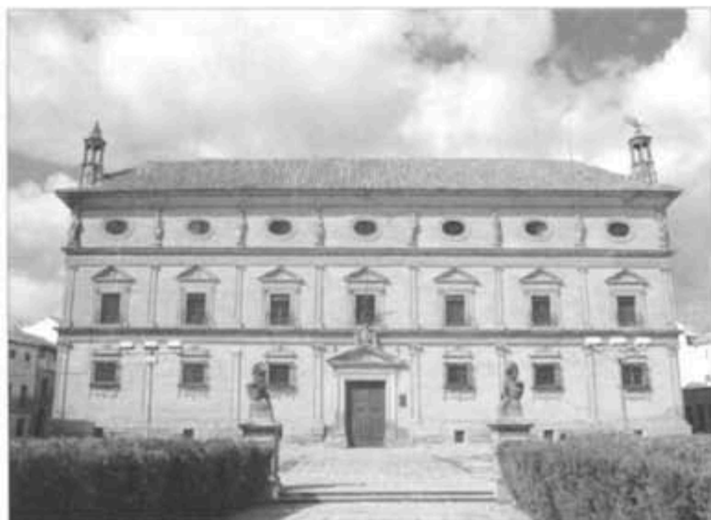
Palacio de Las Cadenas de Úbeda.

Iglesia de Santa María de los Reales Alcázares: Arquitectura renacentista; Rejería (rejas de la Capilla de la Yedra -de Maestro Bartolomé-, rejas de las Capillas de los Becerra y de Ntra. Sra. de Guadalupe,-atribuidas a Maestro Bartolomé- reja del coro )