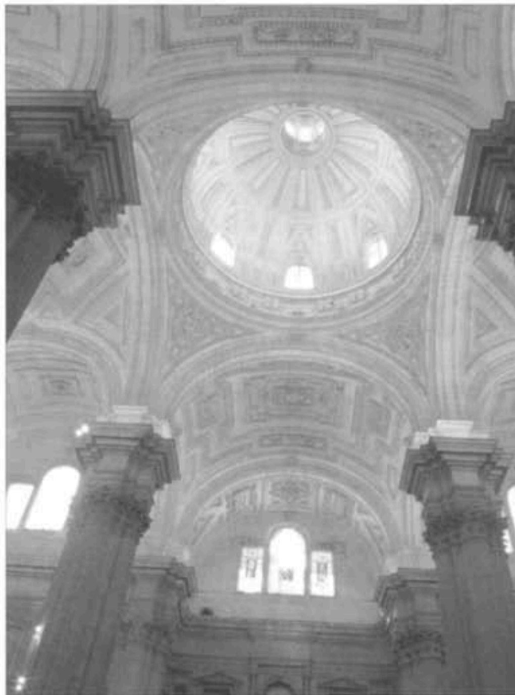
Interior de la Catedral de Jaén.

- Arquitectura renacentista: Andrés de Vandelvira. Destacan los espacios arquitectónicos de la