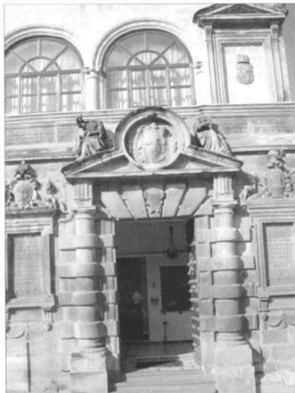
Fachada de las antiguas Casas Consistoriales de Martos

Iglesia de Santa Marta: Arquitectura renacentista. Iglesia columnaria característica de la orden de calatrava. Francisco del Castillo "El Mozo".