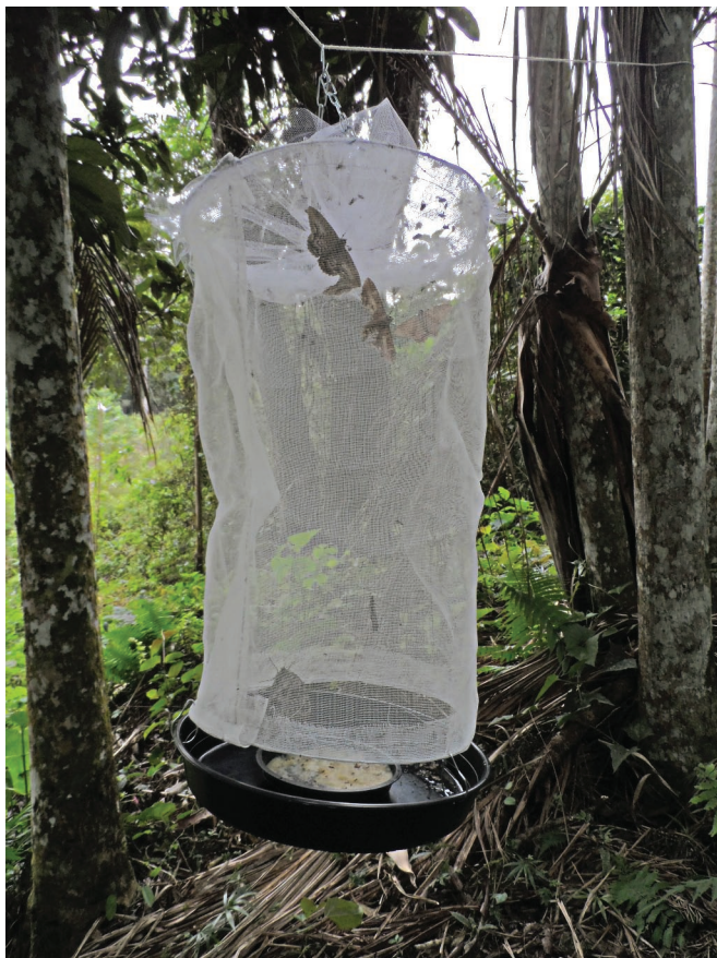
Figura 1. Armadilha atrativa do tipo Van Someren-Rydon em campo.

Um total de 54 armadilhas atrativas do tipo Van Someren-Rydon (Figura 1) (BATRA 2006), com modificações de alguns materiais como os da base, onde a placa de metal foi substituída por um recipiente de plástico, foram instaladas a uma altura aproximada de 1,5 m do solo e divididas em três conjuntos. Cada conjunto foi composto por três armadilhas atrativas, contendo 200 mL de isca (uma de cada tipo), distantes 25 m entre si. Os conjuntos foram separados por uma distância de 225 m e permaneceram em campo por 48 h por coleta, perfazendo um total de 288 h de esforço amostral. As iscas utilizadas foram as mesmas propostas para lepidópteros frugívoros, “Abacaxi com Caldo de Cana” (UEHARA-PRADO 2004), “Banana com Caldo de Cana” (SILVA et al. 2012) e “Banana com Água” (SILVA et al. 2010), preparadas a uma proporção de três partes de fruta pra uma de líquido (3:1) e fermentadas previamente por 48 horas (BATRA 2006).